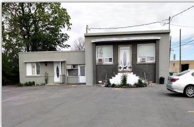
Clinique vétérinaire Liesse