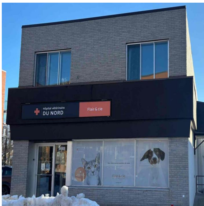
Hôpital vétérinaire du Nord