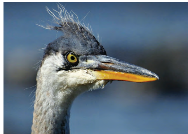
Grand Héron