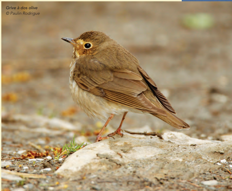
Grive à dos olive