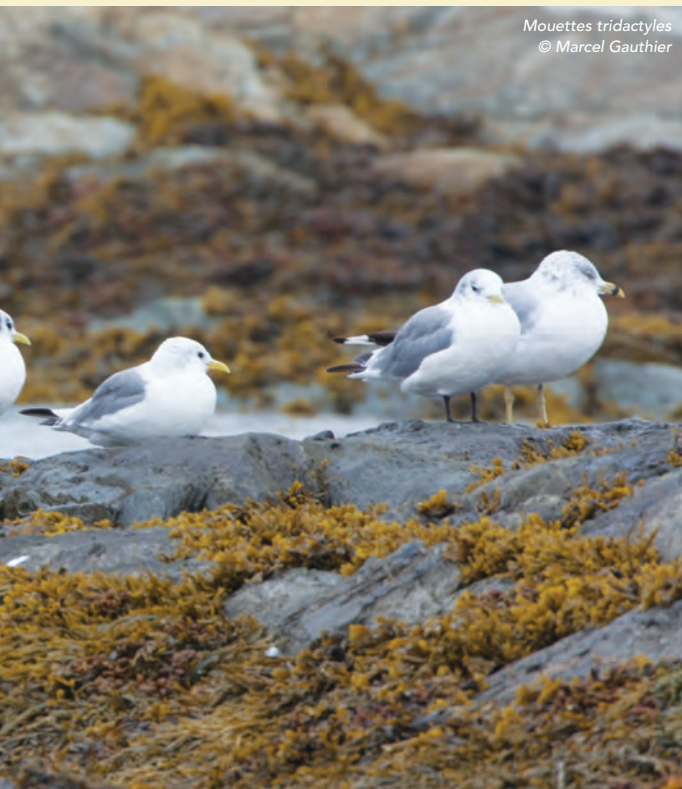
Mouettes tridactyles