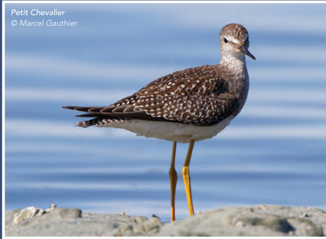
Petit Chevalier

L'observation des oiseaux, une activité de plein air parmi les plus populaires en Amérique.