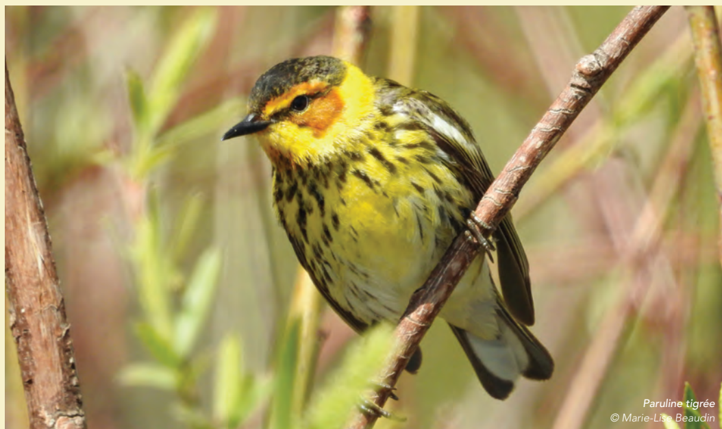
Paruline tigrée © Marie-Lise Beaudin