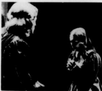
Jusqu'ici soumise à son mari Iago, Emilia secourera le joug en le dénonçant comme traître. Il tirera l'épée contre elle et lui transpercera les reins.