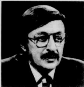
« Le Championnat de natation du Canada ». Commentateur: Jean-Maurice Bailly. Analyste: Jean-Marie de Koninck. Réal.: Jacques Primeau.