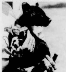
Les Chiens sauvages d'Afrique. Documentaire réalisé par Hugo Van Lawick pour la National Geographic Society. Jane Goodall et son mari, le baron Van Lawick, observent les mœurs curieuses des chiens sauvages de la brousse africaine.