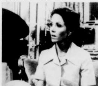
Après tant d'années