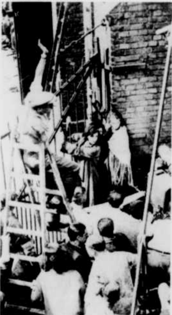
La Tragédie de la mine

Virulent critique social, déjà connu comme un des réalisateurs allemands de premier plan, Pabst a porté un grand coup avec la Tragédie de la mine . Par-delà la solidarité ouvrière, il a voulu exalter la fraternité de deux peuples et condamner l'éventualité d'une nouvelle guerre franco-allemande. A cause du nazisme, il faut attendre 1947 avant de revoir Pabst exprimer avec la même densité la générosité et le respect des valeurs humaines.