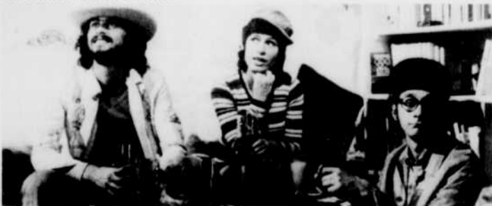
Un enfant dans la ville

Un enfant dans la ville est une belle réalisation qui offre deux originalités. D'abord, c'est la première fois qu'un disque se transforme en comédie musicale. Ensuite, parce que ce disque sortant avant l'émission de télévision, le public européen connaissait déjà les chansons, dont certaines furent des « tubes ».