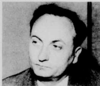
Mgr Maurice Roy