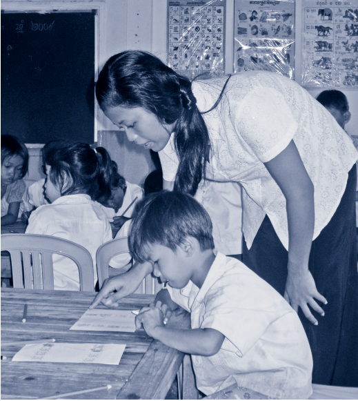
Une laïque associée s.m.é., enseignante au Cambodge

vigoureux pour éviter que le corps constitué ne procède à un rejet du corps greffé.