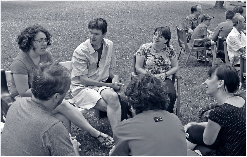
Partage en petit groupe lors d'une célébration

nir comme une école pour la mission ad extra . La façon avec laquelle j'apprends dans la communauté (un espace sécuritaire) à accueillir et découvrir une personne, avec toutes ses différences, va devenir un merveilleux chemin d'apprentissage à la mission dans une société pluraliste. Dans le livre des Actes des Apôtres, les défis liés à la vie de la communauté initiale des chrétiens va devenir une préparation, une école et même une impulsion pour la mission qui va mener les apôtres à franchir toutes les frontières géographiques, culturelles et théologiques.