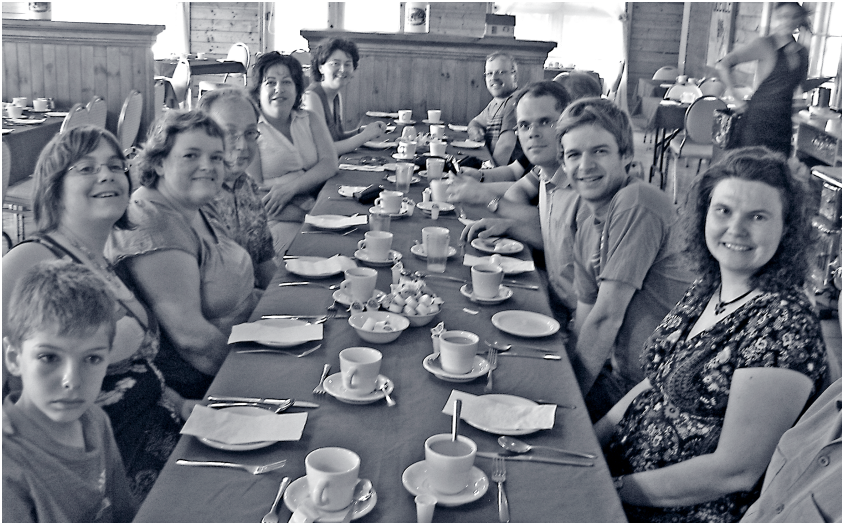
Repas en communauté — Le Tisonnier

munauté. Ce premier passage est important. Mais il n'est pas suffisant. Il est apparu que l'effort mis sur la vitalité et le rayonnement de la communauté, même si essentiel et capital pour la mission, ne pouvait pas résumer toute l'activité missionnaire de l'Église. Il y aurait sinon le risque de croire que de mettre tous nos efforts à vivre une belle communauté est suffisant pour définir notre participation à la Mission de Dieu. L'activité missionnaire demande également de s'engager pour la justice sociale, le respect de la création, le dialogue interreligieux (et œcuménique et humanitaire) et l'effort d'inculturation. Il faut donc également dépasser (sans annuler) la perspective communautaire et faire un second passage à une compréhension de la mission qui