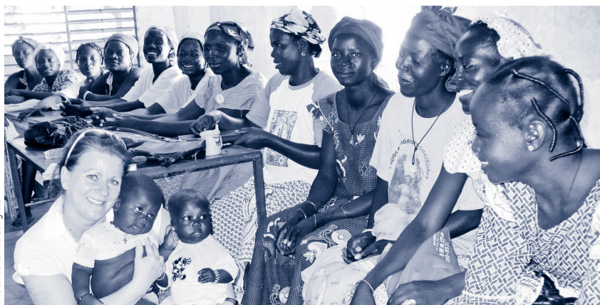
Une laïque associée s.m.é., missionnaire au Burkina Faso

personnes laïques n'ont jamais connu d'autres modèles que celui des instituts qui ont exprimé le charisme reçu à leur manière propre.