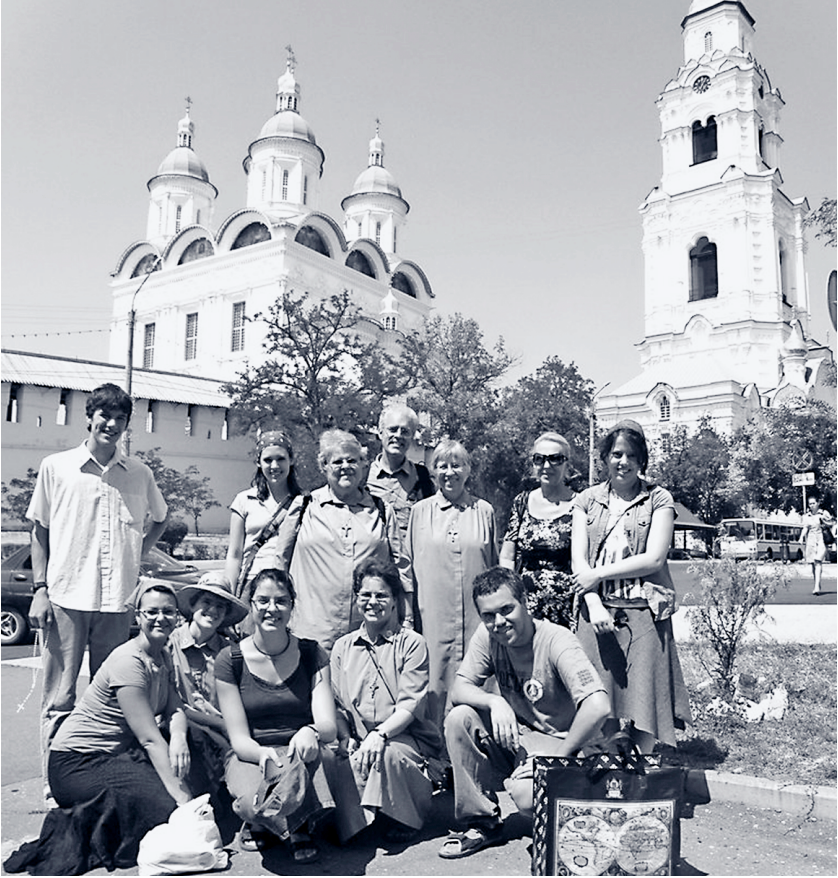
Expérience missionnaire avec des 18-30 ans en Russie

russe. Nous sommes aussi impliqués en liturgie et en catéchèse, dans notre paroisse catholique d'Astrakhan.