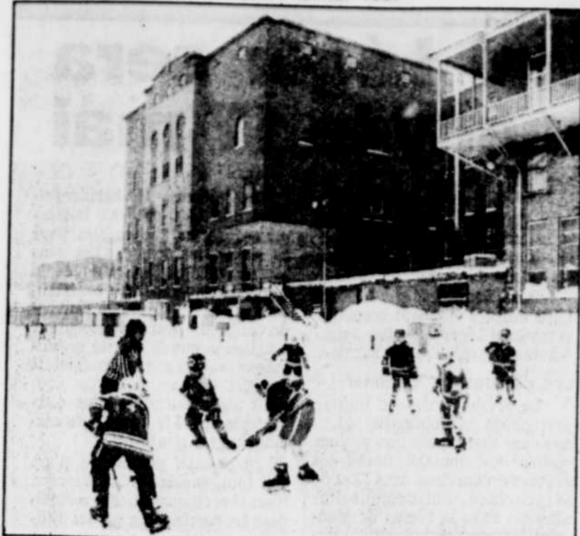
L'édifice du Patro Saint-Vincent qui a souvent été un point de ralliement pour les jeunes, hébergera bientôt un refuge pour jeunes ex-détenus, la maison Marie-Frédéric.