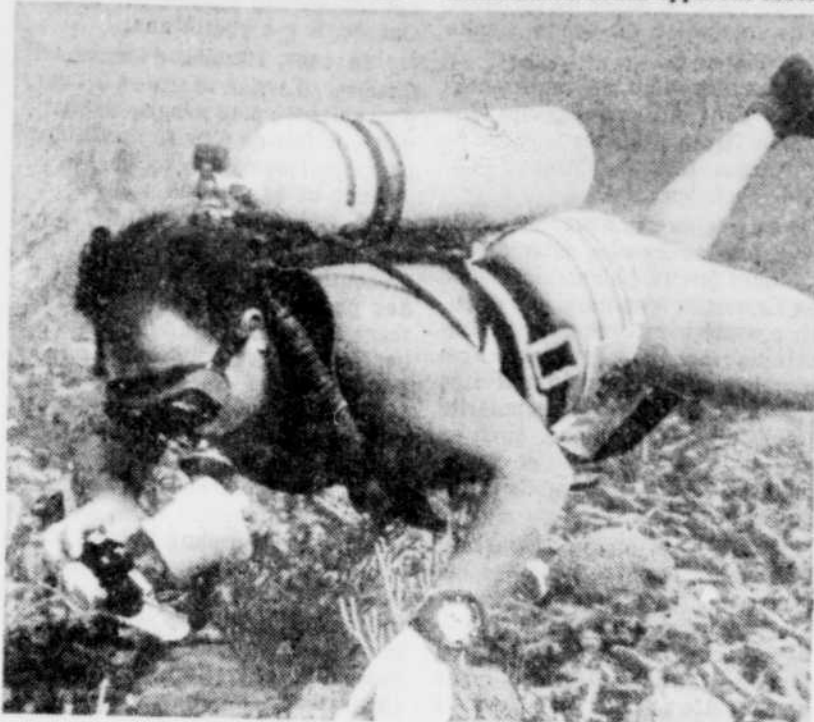
Oublier son appareil-photo dans un avion c'est pardonnable, mais son costume de plongée sous-marine... Et ça arrive!

"J'ai compris la colère du type lorsque l'assureur m'a dit que l'homme avait réclamé $1,800 pour la caméra. Or, c'était un vieil appareil ne valant pas grand chose."