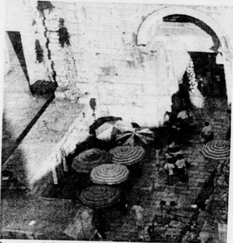
La cour centrale du palais de Dioclétien, à Split en Yougoslavie.