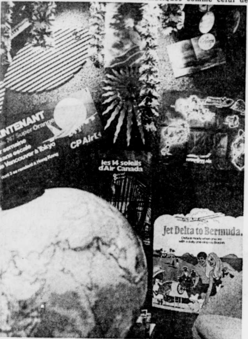
Le rêve...partout dans le monde! Des informations toujours changeantes.