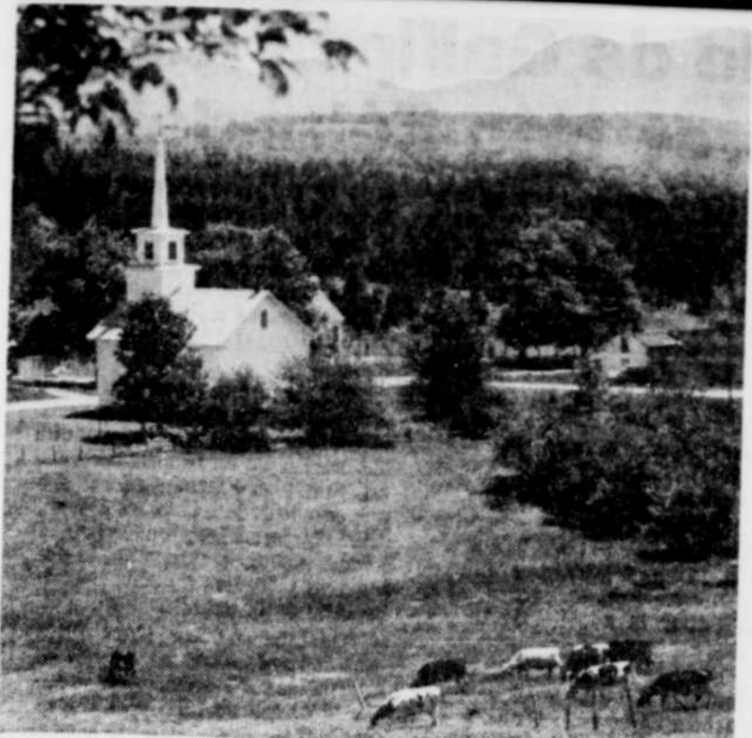
Il peut être très agréable de faire de la promenade dans l'état du Vermont l'été.