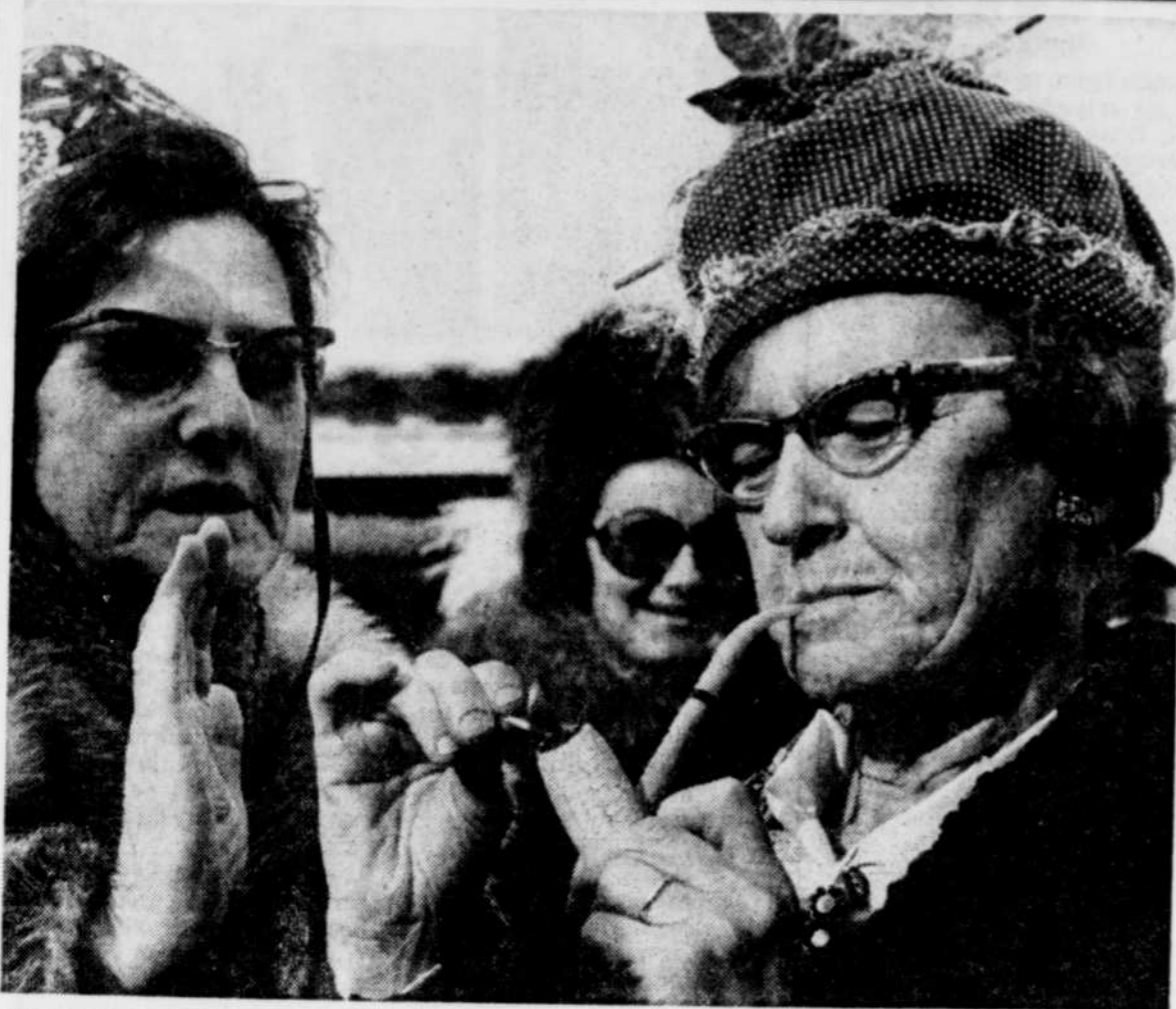
Une bonne pipée comme dans le temps...