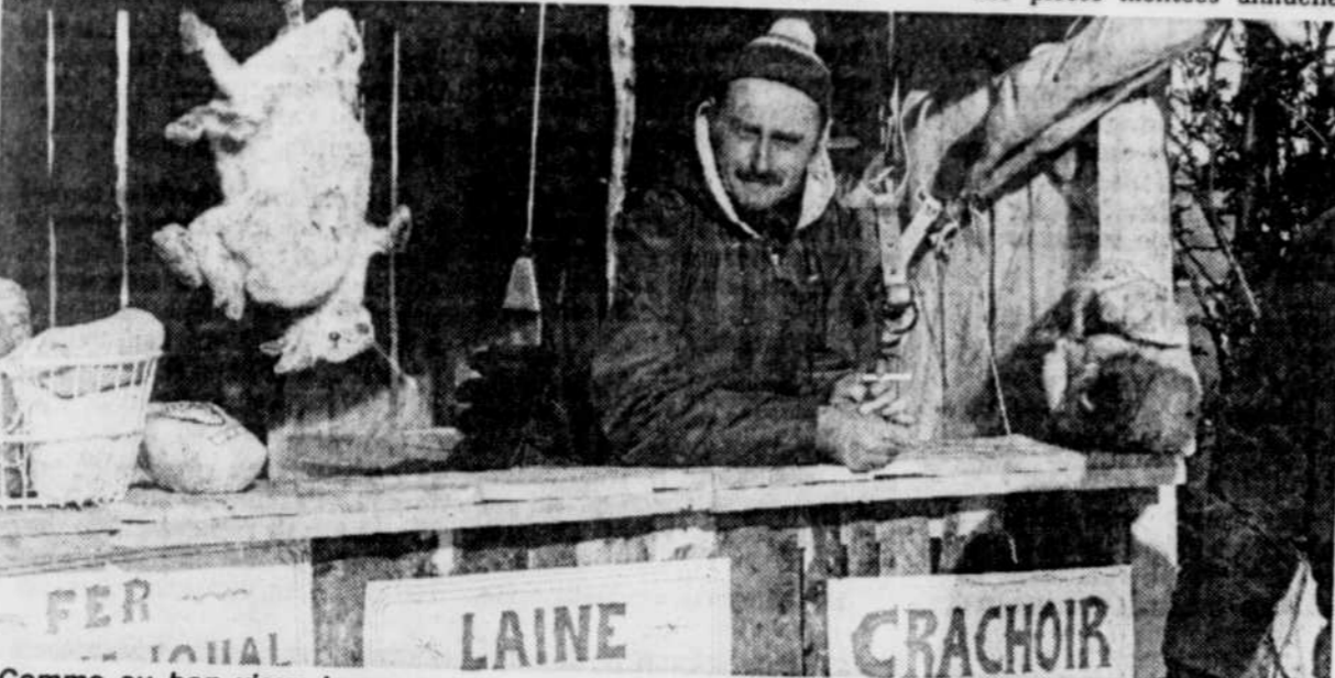
Comme au bon vieux temps...

Soulignons enfin que les touristes qui se rendront à Chicoutimi au cours des prochains jours pour assister au Carnaval-Souvenir se verront proposer d'autres activités par les villes voisines, celles-ci mettant à profit la période de la mi-février afin de planifier certaines manifestations touristiques hivernales. Soulignons à ce chapitre le festival "Jonquière en neige".