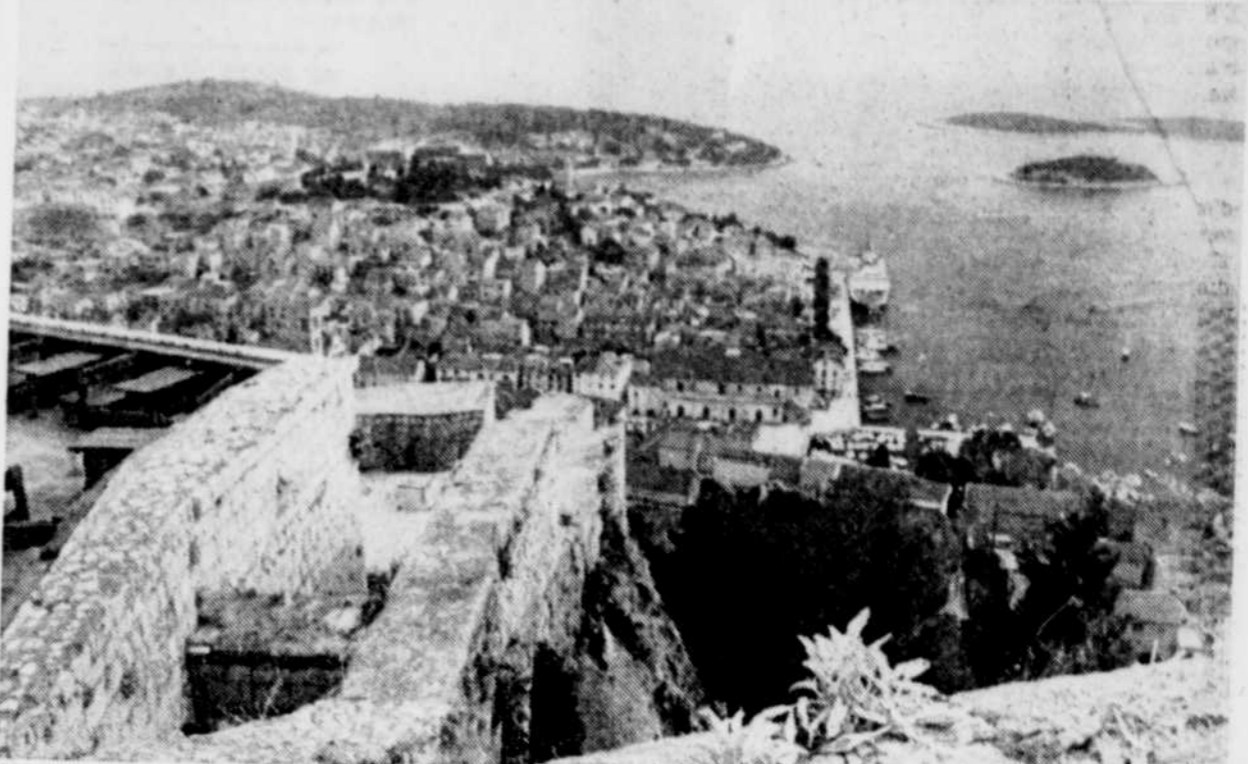
Hvar, une des plus grosses îles de la mer Adriatique au large de la côte dalmatienne, en Yougoslavie.

également disponibles vers diverses îles de l'Adriatique, vers Dubrovnik.