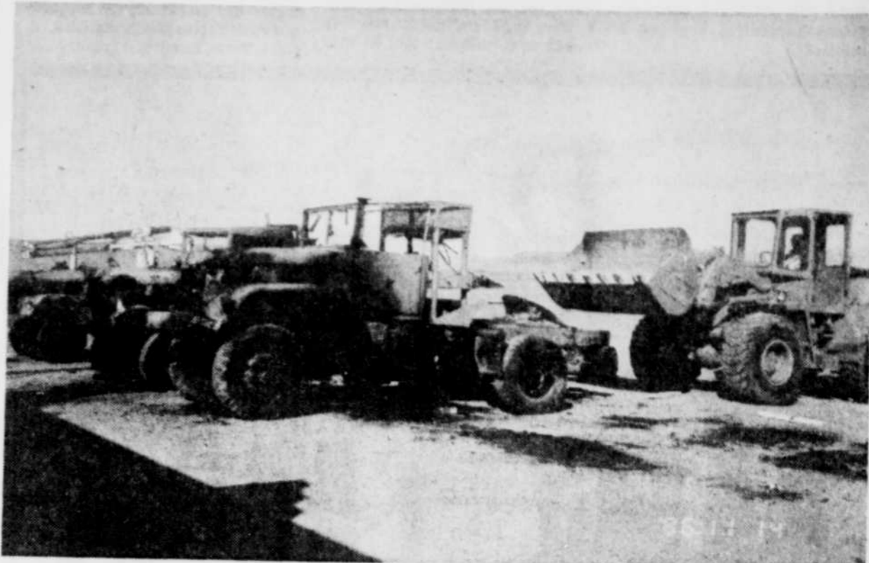
Les camions de l'armée soviétique auront bien souffert de leur mauvaise rencontre avec James Bond. Une benne mécanique les dégage du plateau de tournage de Ouarzazate.

niers et sa verdoyante palmeraie, il y a tout pour vous écrier... "y aurait-il un rôle pour moi dans un "re-make" du Cheik d'Arabie?"