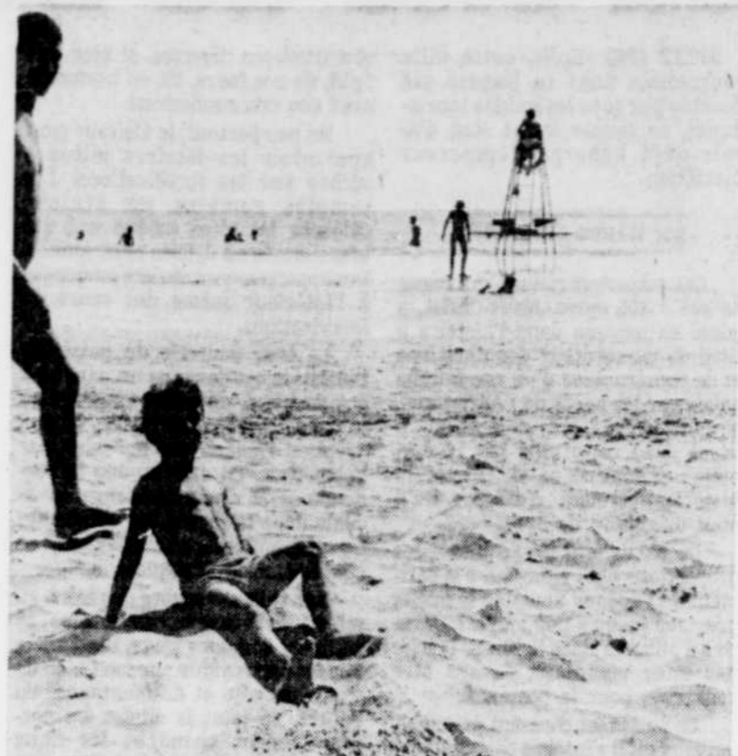
Le Maroc a plus que ses belles plages à offrir aux touristes.

Bref, le ministre souhaite que les futurs visiteurs viennent s'aérer les poumons et contempler les paysages farouches du Moyen-Atlas plutôt que de se transformer bêtement en lézards de plage sur les sables d'Agadir. ♦