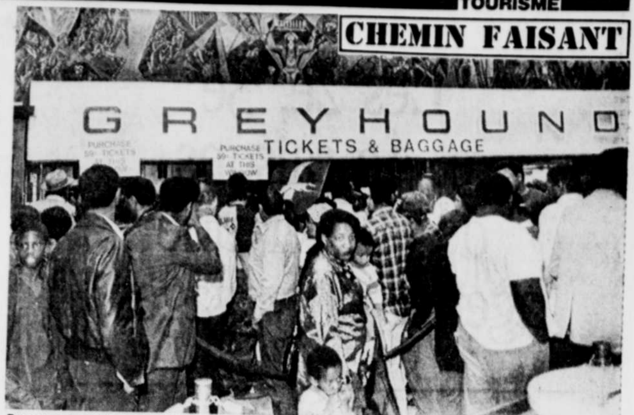
Des centaines de gens ont fait la file mercredi au terminus de la compagnie Greyhound, à Nouvelle-Orléans, pour acheter des billets à $0.59 pour des voyages n'importe où aux États-Unis ce printemps. Cette promotion d'une heure a attiré plus de 25,000 personnes.

On peut rejoindre Vermont Hiking Holidays, au P.O. Box 845, Waitsfield, Vermont 05673, (802)-496-2219.