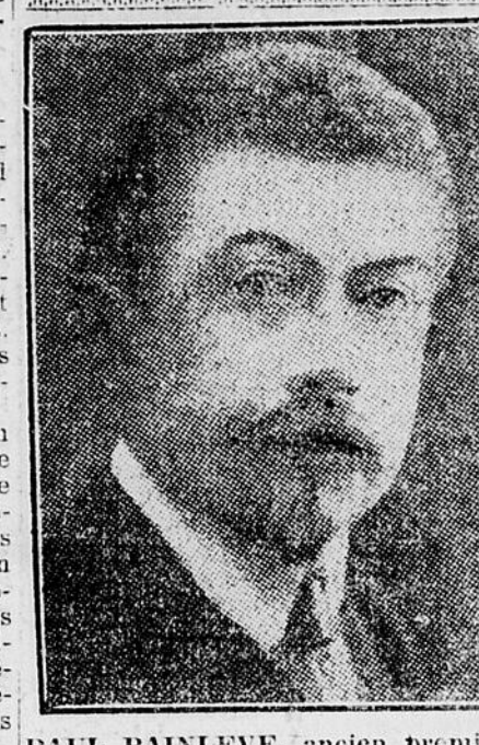
PAUL PAINLEVE, ancien premier ministre de France, est arrivé à New-York ces jours derniers en route pour la Chine. Il pré- sente une mission française déléguée en Chine.