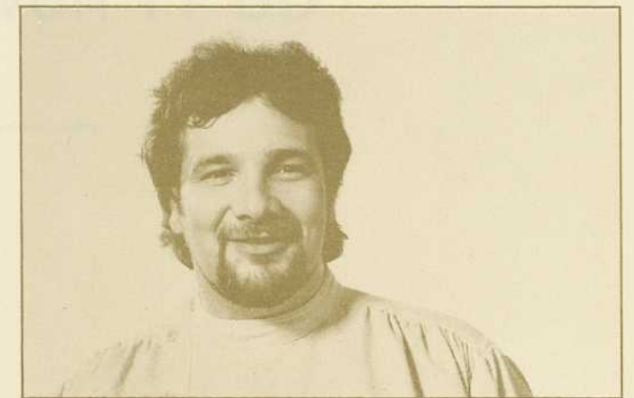
Mise en scène de Gilbert Lepage