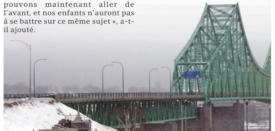
L'approche du pont J.C. Van Horne fait partie des terrains couverts par l'entente.