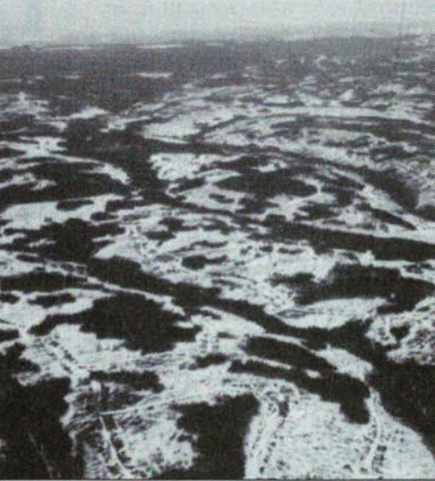
La forêt gaspésienne ou plutôt de ce qui en reste...

À LA SUITE DU GRAND rendez-vous des régions tenu à l'automne 2002, une grande question est demeurée sans réponse : comment faire en sorte que les régions dites ressources du Québec puissent recevoir le maximum de retombées économiques de leurs ressources naturelles ? Plus précisément, les représentants régionaux présents à ce sommet ont demandé au gouvernement du Québec de retourner dans les régions les redevances perçues sur les ressources naturelles, notamment sur la forêt publique et le patrimoine minier et énergétique.