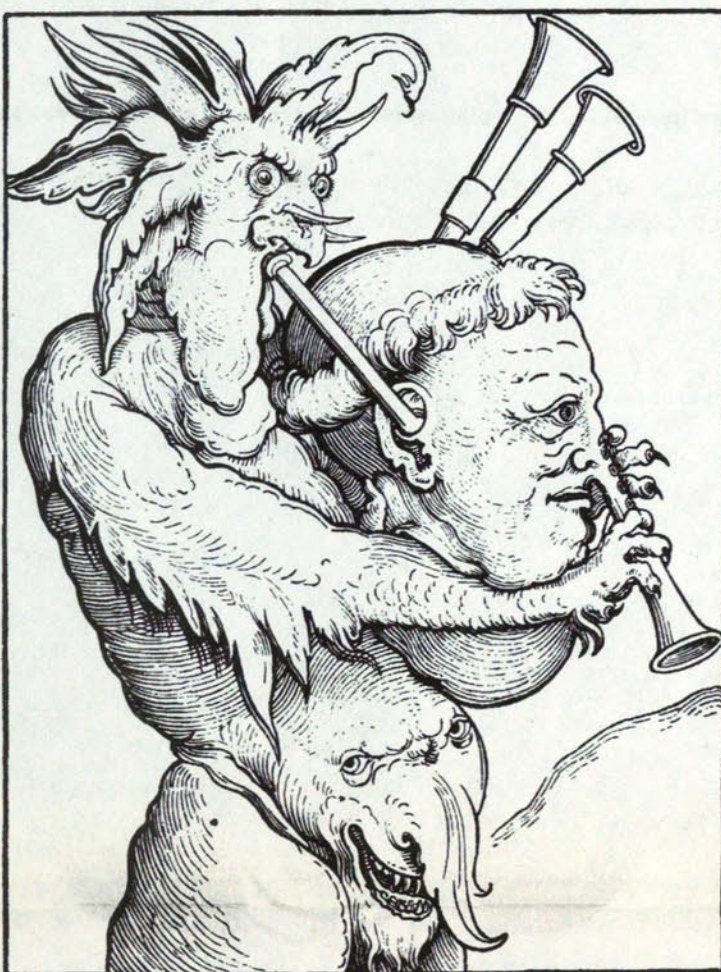
Gravure sur bois d'Erhard Schön (1500-1542)

Mais quand l'avertissement vient d'un officier de l'armée canadienne, spécialiste de la propagande et