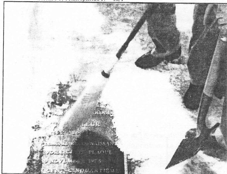
Fig. 1. Quand la plaque Pasteur sera-t-elle relevée? □

Prochain rendez-vous «Pasteur parlait français»: le jeudi 23 mars 1995. Midi, Place Pasteur à Montréal. Métro UQAM.