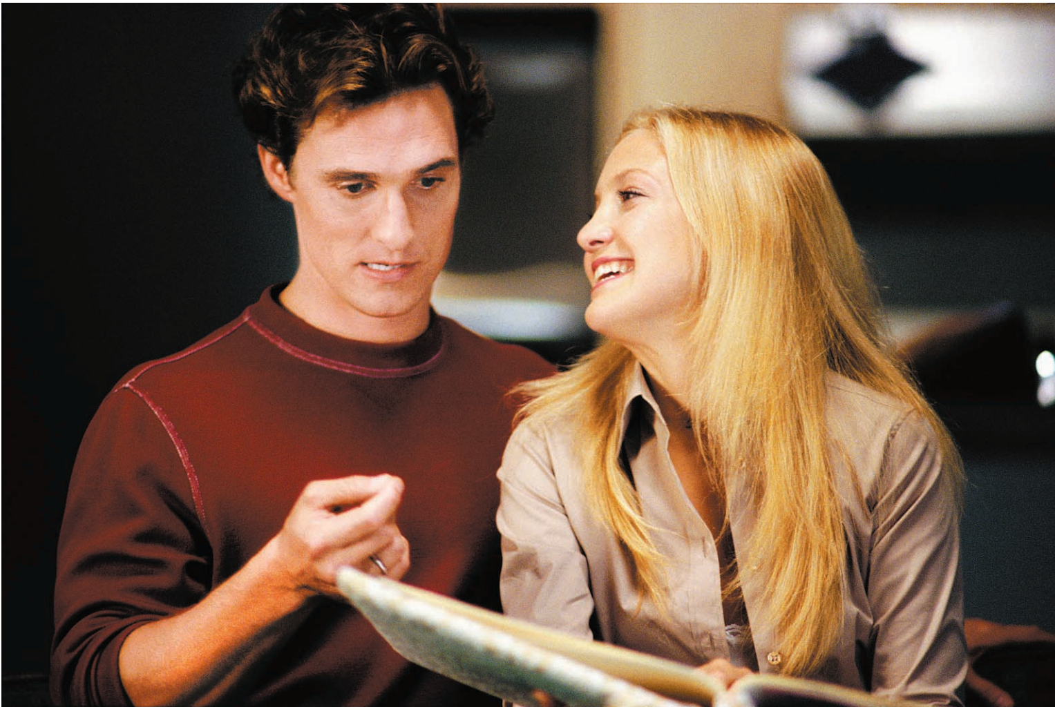
Dans How to Lose a Guy in 10 Days , Matthew McConaughey et Kate Hudson sont tous les deux l'objet d'un pari.