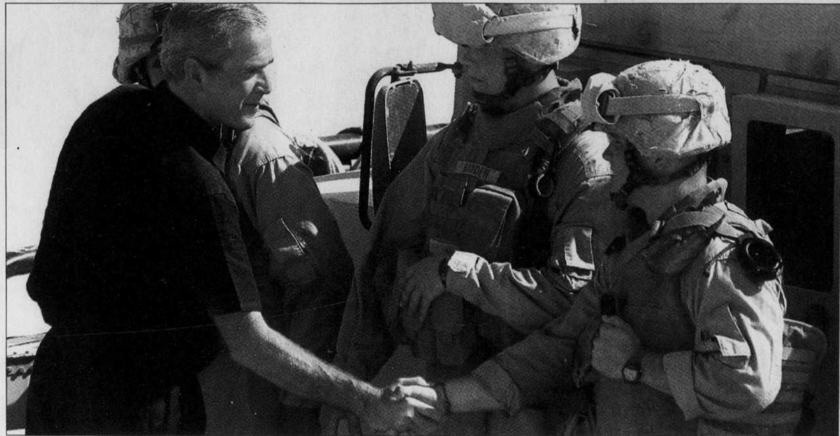
George W. Bush s'est fait abondamment photographier avec des militaires, hier, au cours d'une visite-surprise effectuée en sol irakien.