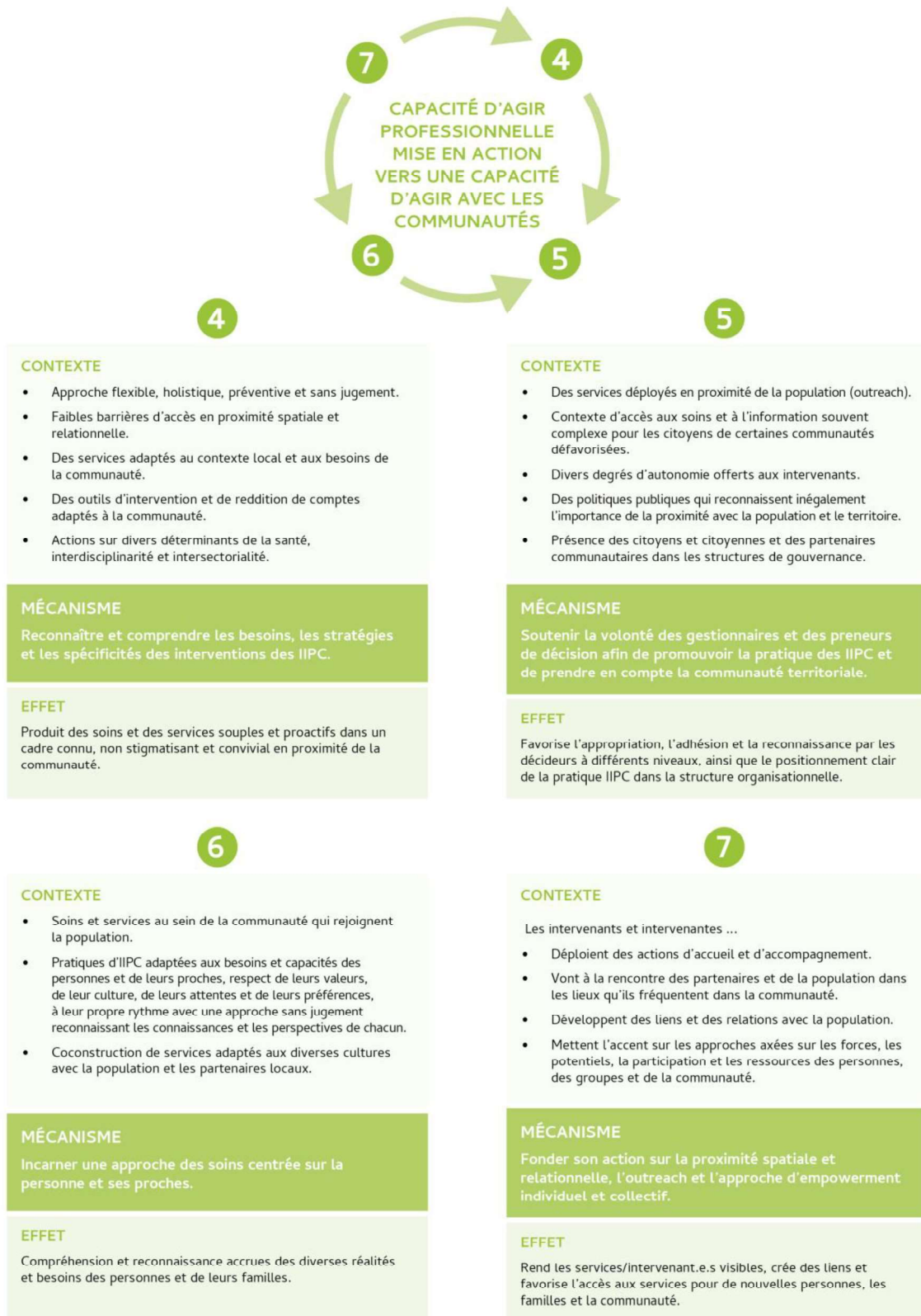
Figure 2. Dimension « Capacité d'agir professionnelle mise en action vers une capacité d'agir avec les communautés »