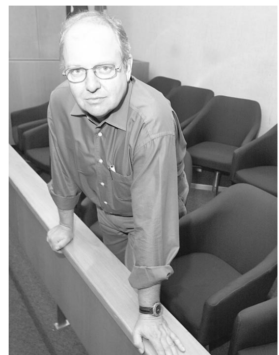
Le comédien Vincent Bilodeau

Afin de permettre à toute l'équipe de L'Affaire Dumouchon de reprendre son souffle, la pièce prendra l'affiche une semaine après la date prévue, soit le 17 avril, et sera présentée jusqu'au samedi 19 mai à La Licorne.