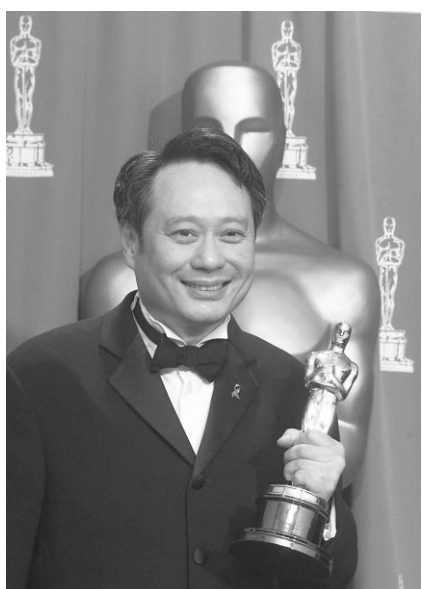
Steven Soderbergh ( Traffic, photo du haut) et Ang Lee ( Tigre et Dragon), parmi les grands gagnants de la soirée des Oscars de dimanche.

Des cinq films en nomination dans la catégorie du meilleur film de l'année, seul Chocolat est parti bredouille. Quand elle est arrivée sur le tapis rouge et qu'un intervieweur lui a planté un micro sous le nez en lui demandant si elle croyait repartir chez elle avec un Oscar, Juliette Binoche a répondu par un grand éclat de rire. « Je serais vraiment, mais vraiment très surprise ! » La vedette de Chocolat n'en a pas moins attiré tous les regards en arborant un look spectaculaire à la Joséphine Baker.