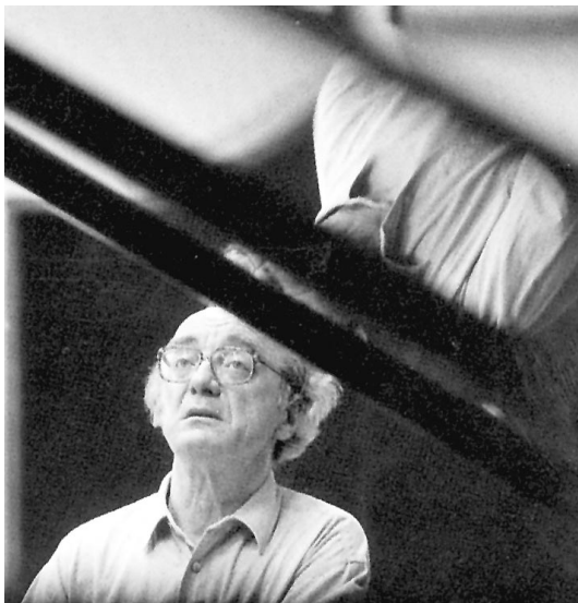
Alfred Brendel, de retour à Montréal après douze ans d'absence.