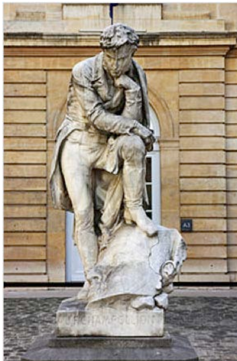
Fig. 2. Collège de France rue des Écoles, la statue de Champollion, un pied sur la pierre de Rosette. http://fr.wikipedia.org/wiki/Jean-François_Champollion , L'auteur de cette statue, Bartholdi est surtout connu pour sa statue de la Liberté éclairant le Monde sur l'Île Staten dans le Port de New-York.