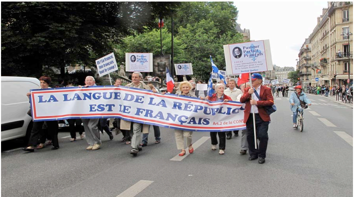
Fig. 1. La grande marche ALF avec participation évidente de la LISULF. Saisie Rue des Écoles, le Collège de France à gauche avec la statue de Champollion, un pied sur la pierre de Rosette. À droite la rue Thénard, éponyme de Louis-Jacques Thénard, chimiste. Réf. 1