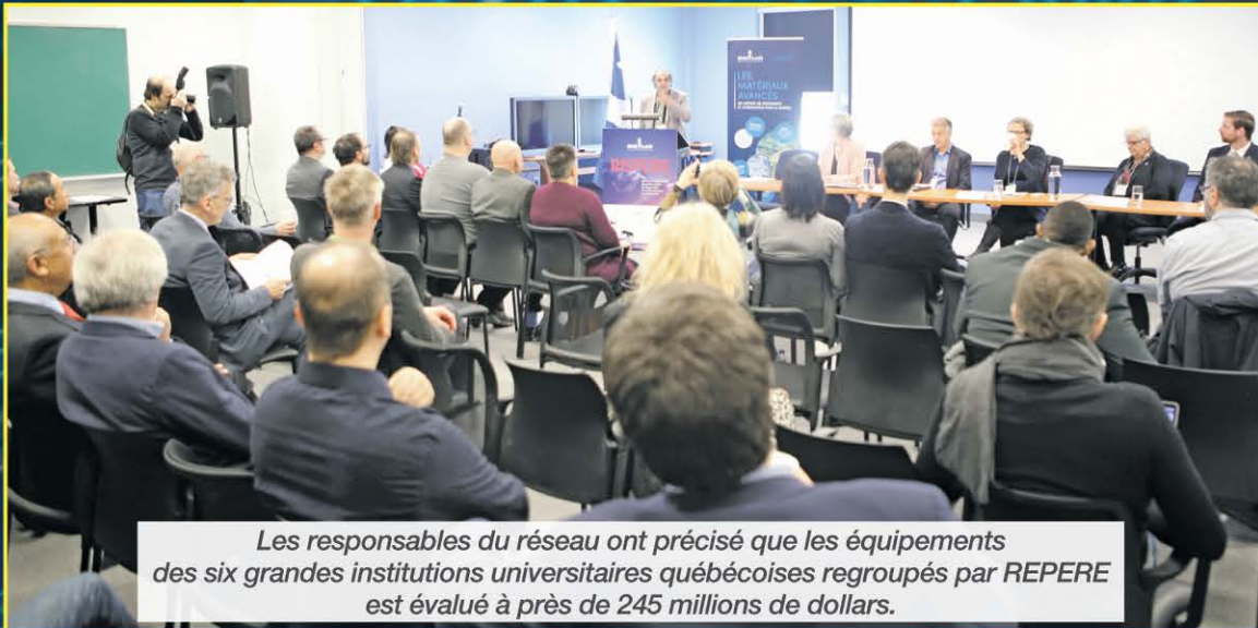
Les responsables du réseau ont précisé que les équipements des six grandes institutions universitaires québécoises regroupés par REPERE est évalué à près de 245 millions de dollars.

« Dès le début des années 2000, dans le contexte de NanoQuébec, une vaste concertation a eu lieu entre les chercheurs des universités québécoises pour mettre sur pied des infrastructures complémen-