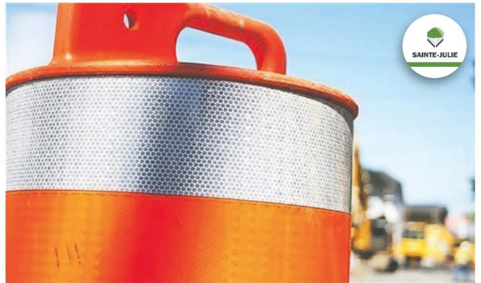
Le conseil a accordé le contrat des travaux de réfection majeure d'infrastructures sur la rue de Grenoble à l'entreprise Eurovia Québec Construction pour plus de 1 700 000 $.