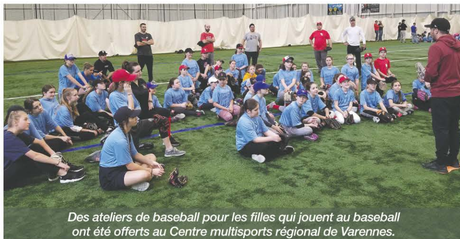
Des ateliers de baseball pour les filles qui jouent au baseball ont été offerts au Centre multisports régional de Varennes.

Sur la Rive-Sud, les filles sont très présentes à Varennes et à Sainte-Julie, avec respectivement cinq et sept équipes en 2018. « Ces associations locales