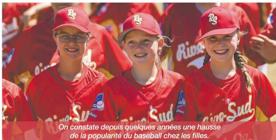
On constate depuis quelques années une hausse de la popularité du baseball chez les filles.