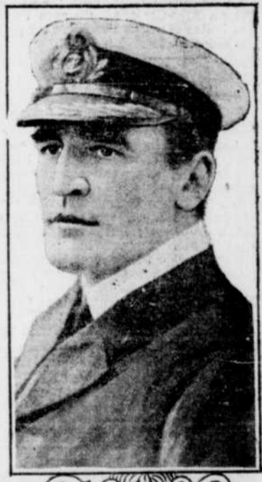
LE COMMODORE REYNOLDS G. TYRWHITT qui commandait les croiseurs légers et les contre-torpilleurs anglais durant l'engagement naval dans la mer du Nord.

L'escadre anglaise commandée par le vice-amiral Sir David Beatty, le 25 janvier, aperçut quatre croiseurs allemands, plusieurs croiseurs légers et un bon nombre de contre-torpilleurs se dirigeant vers l'Ouest apparemment du côté de l'Angleterre. Aussitôt les ennemis se mirent à fuir à toute vitesse. Nous nous lançâmes à leur poursuite et vers 9.30 heures, le combat s'engagea entre les croiseurs "Tiger", "Lion", "Princess Royal", "New-Zealand" et "Indomptable", d'un côté, et le "Derflinger", le "Seeylitz", le "Moltke", et le "Blucher", de l'autre.