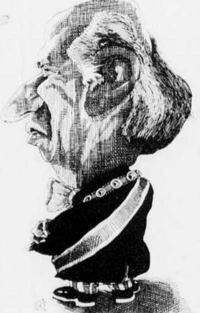
Carlos Andres Perez, président du Venezuela

mée à laquelle le président a fait appel devant l'ampleur du mouvement. Les délinquants et des franc-tireurs — agitateurs professionnels, mais liés à aucun mouvement subversif, selon le gouvernement — sont apparus et, après la mort d'un officier dans la nuit de mercredi à jeudi, les militaires,