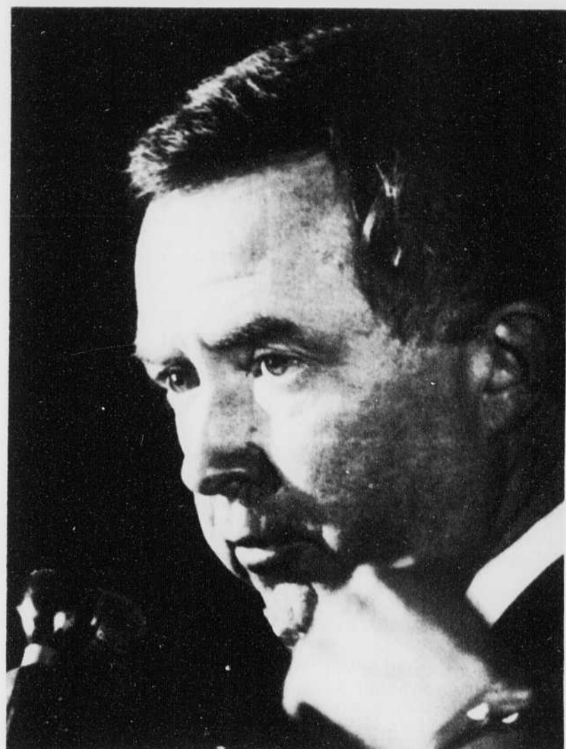
Le secrétaire d'Etat aux Affaires extérieures du Canada, Joe Clark.

Cependant, il n'y aura aucune réduction des contrôles en vigueur sur le matériel nucléaire ou militaire, a souligné M. Clark.