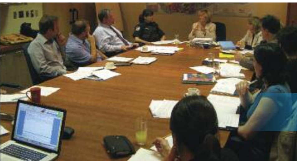
Rencontre du Comité terrain RUI

tionnelle, fortement participative, a été élaborée et mise en place. Celle-ci est composée de sept comités de travail et de deux comités de réflexion. Le plan d'action, qui se veut un guide souple et ouvert, et inscrit dans le cadre du développement durable, est élaboré sur la base de projets auxquels les partenaires et la population pourront se joindre tout au long de la démarche. Il propose une stratégie qui s'énonce comme suit : « Pour bâtir une communauté écocitoyenne d'avant-garde, un nouveau modèle d'urbanité, une nouvelle façon de vivre en ville, au sein du territoire lavallois ciblé pour une revitalisation urbaine intégrée, les partenaires comptent soutenir le développement d'un sentiment d'appartenance et de fierté des citoyens envers leur milieu, augmenter leur capacité d'agir en vue d'améliorer leurs conditions et qualité de vie et miser sur le développement durable et l'écocitoyenneté comme moteurs de développement ».