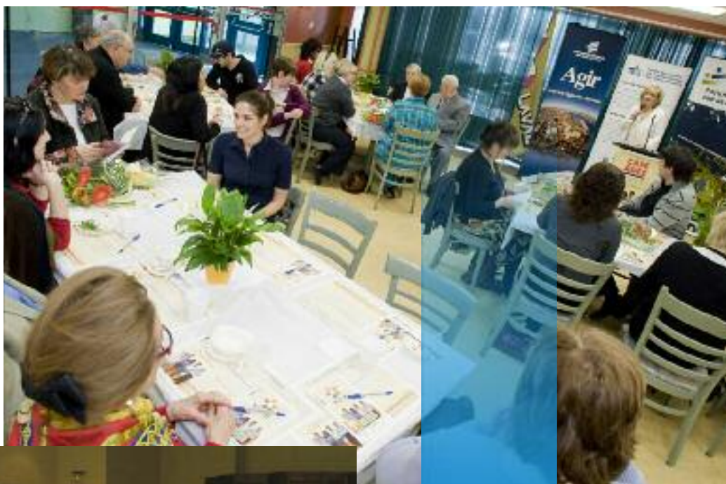
Café des âges