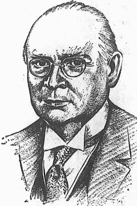
Le Très Hon. R. B. BENNETT, Premier Ministre du Canada

L'article 98 du Code Criminel déclare illégales les activités communistes au Canada. Cet article est notre seule protection, notre seul rempart contre le plus grand danger social de tous les temps.