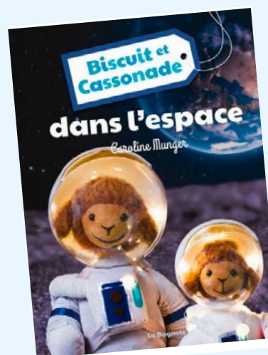
Biscuit et Cassonade dans l'espace / Caroline Munger

Ernest trouve difficile de se concentrer à l'école. Son manque de concentration lui vaut des moqueries des autres petits lapins. Ce qu'ils ne savent pas, c'est qu'Ernest est un explorateur hors pair! Lors d'un voyage en camping avec l'école, il prouva sa valeur et sa bravoure en portant secours à un camarade grâce à ses connaissances de la forêt et des étoiles! Album illustré.