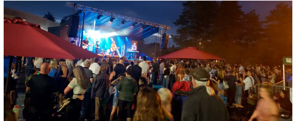
À Saint-Basile-le-Grand, la fête nationale aura lieu au parc du Ruisseau.

La Maison des jeunes La Butte servira des hotdogs, des sandwiches au fromage grillé, du maïs soufflé, des croustilles, des boissons