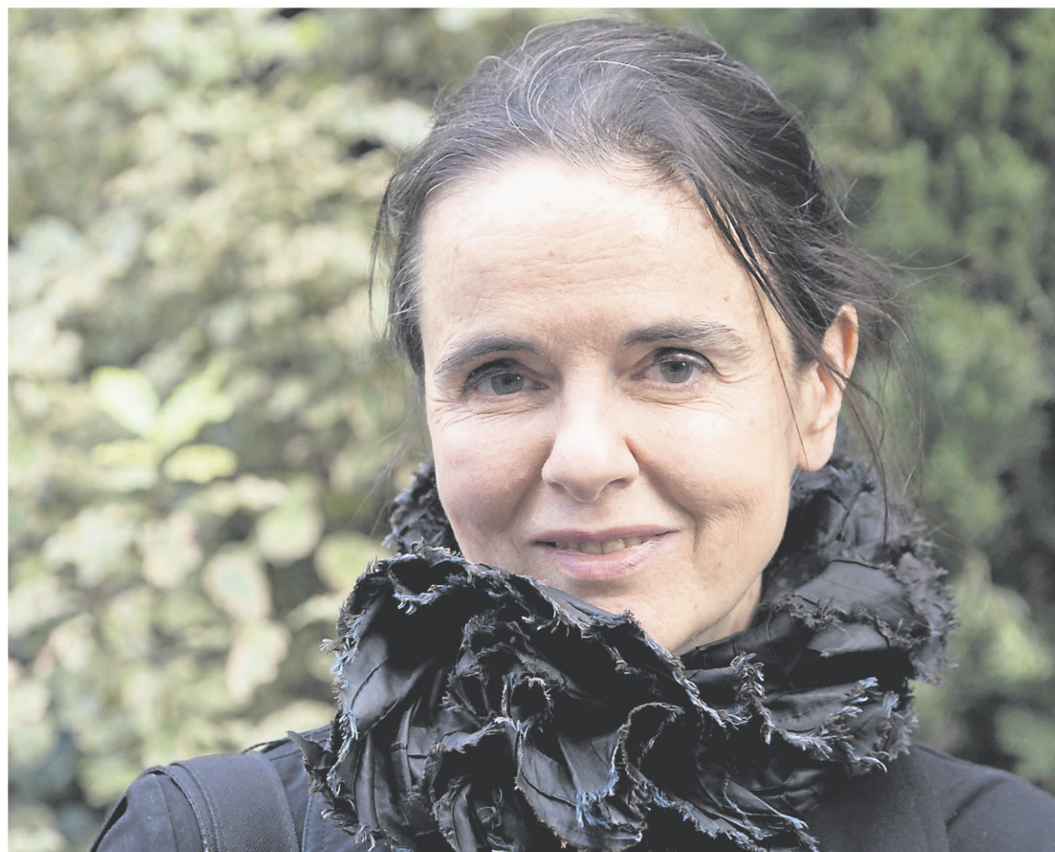
Amélie Nothomb

Dans notre cas, [Juliette] m'a aimé au premier regard. C'est plus fort que nous. Il y a quelque chose de mystique, mais aussi de naturel. Une sœur, c'est la personne au monde avec laquelle on peut le plus être soi-même. [...] C'est peut-être ce mélange