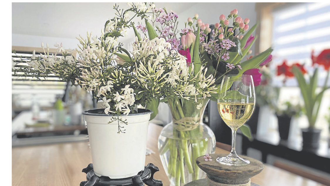
À Pâques, prendre le temps d'apprécier chaque moment, célébrer la vie, plonger dans le renouveau et trinquer à la santé de tous.

Une cuvée digne des bons vins du Haut-Médoc, classique et bien équilibrée, qui a de la matière sans être dépourvue de fraîcheur. Les