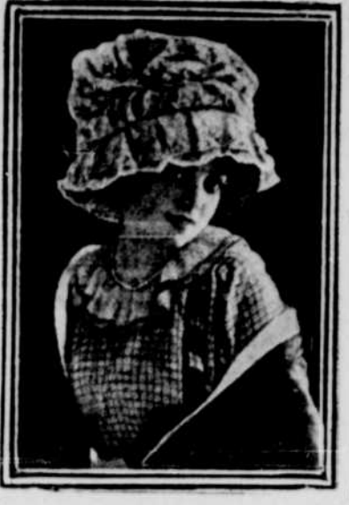
CHAPEAU CHARLOTTE DE DENTELLE BLANCHE

L'Espagne possède un jour la presque totalité de l'Amérique du Sud, une grande partie de l'Amérique du Nord, les Antilles et de nombreuses colonies sur les côtes d'Afrique. C'était le moment où, ardent champion de la cause catholique, elle travaillait à étendre le règne du Christ aux quatre coins de la terre. Mais dès que cesse son rôle apostolique, dès qu'elle commence à être travaillée par les factions anti-religieuses, c'en est fini de sa splendeur. Les querelles intestines lui font perdre son immense empire colonial, l'abaissement des mœurs empêche l'accroissement de sa population et la fait tomber au rang de puissance de quatrième ordre.