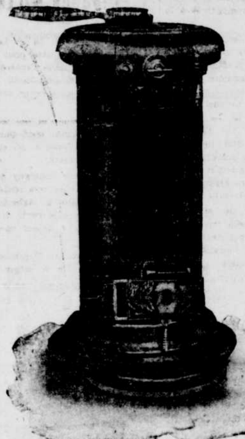
FOURNAISE "QUEBEC", pour le charbon.

Eh, bien! installez votre fournaise dès maintenant.