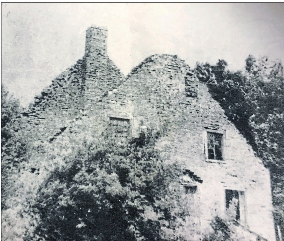
Seule photographie connue montrant presque l'entièreté des murs du moulin banal de la baronnie de Longueuil, parue dans l'édition du 12 septembre 1943 de La Patrie .