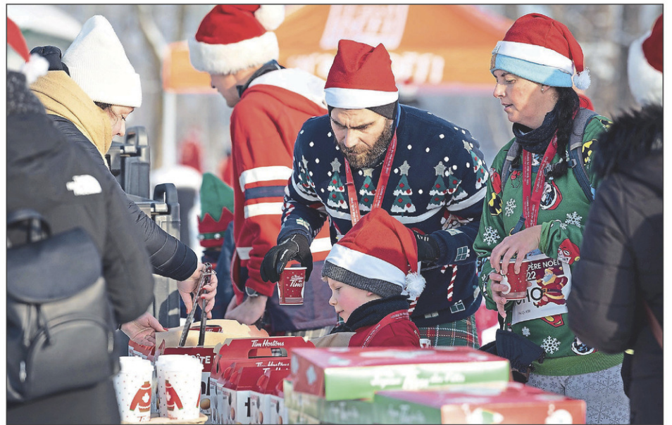
Les participants avaient droit à des beignes et du café en guise de récompense au fil d'arrivée.