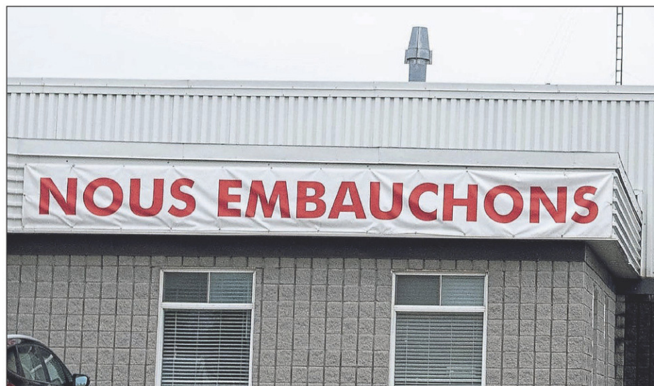
En cette ère de pénurie de main-d'œuvre, des entreprises font preuve de créativité pour recruter et retenir leur personnel, notamment en améliorant les conditions de travail offertes.

Pour lui mentionner ce qui est fait dans votre milieu de travail, il faut lui écrire à smacfarlane@canadafrancais.com. N'oubliez pas de lui laisser vos coordonnées afin qu'elle puisse vous joindre au besoin. Elle attend de vos nouvelles.