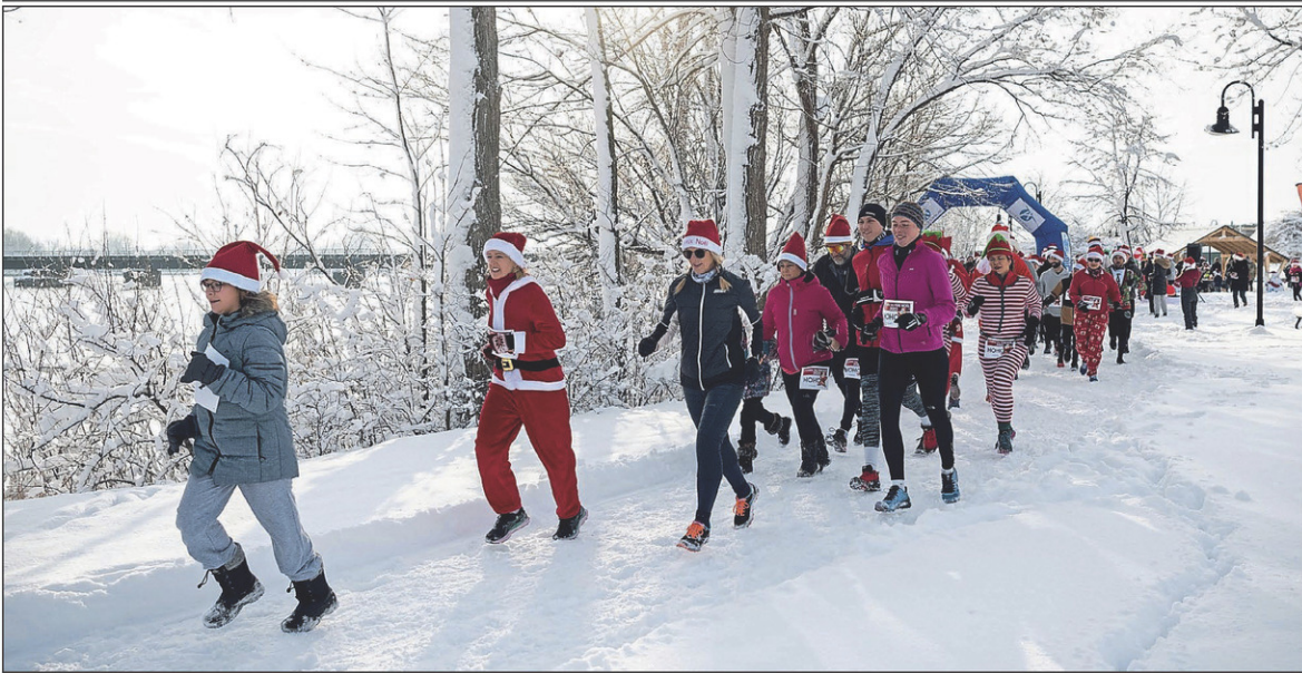
La Course du père Noël a rassemblé 250 coureurs dans un décor fraîchement enneigé, le dimanche 18 décembre, sur la bande du canal de Chambly.