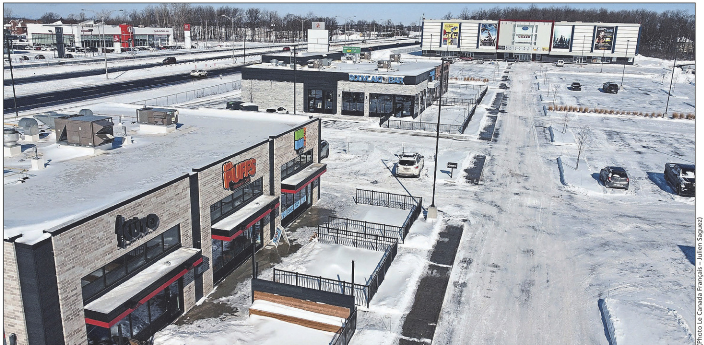
L'entente comprend un lot de près de 182 500 pieds carrés où se trouvent Numéro 7 – Brasserie moderne, Bonbonnerie Nick & Joe, Souvlaki Bar et La Belle & La Bœuf.

Enfin, l'entente comprend le lot de près de 182 500 pieds carrés (9,2 M$) où se trouve Numéro 7 – Brasserie moderne, Bonbonnerie Nick & Joe, Souvlaki Bar et La Belle & La Bœuf.