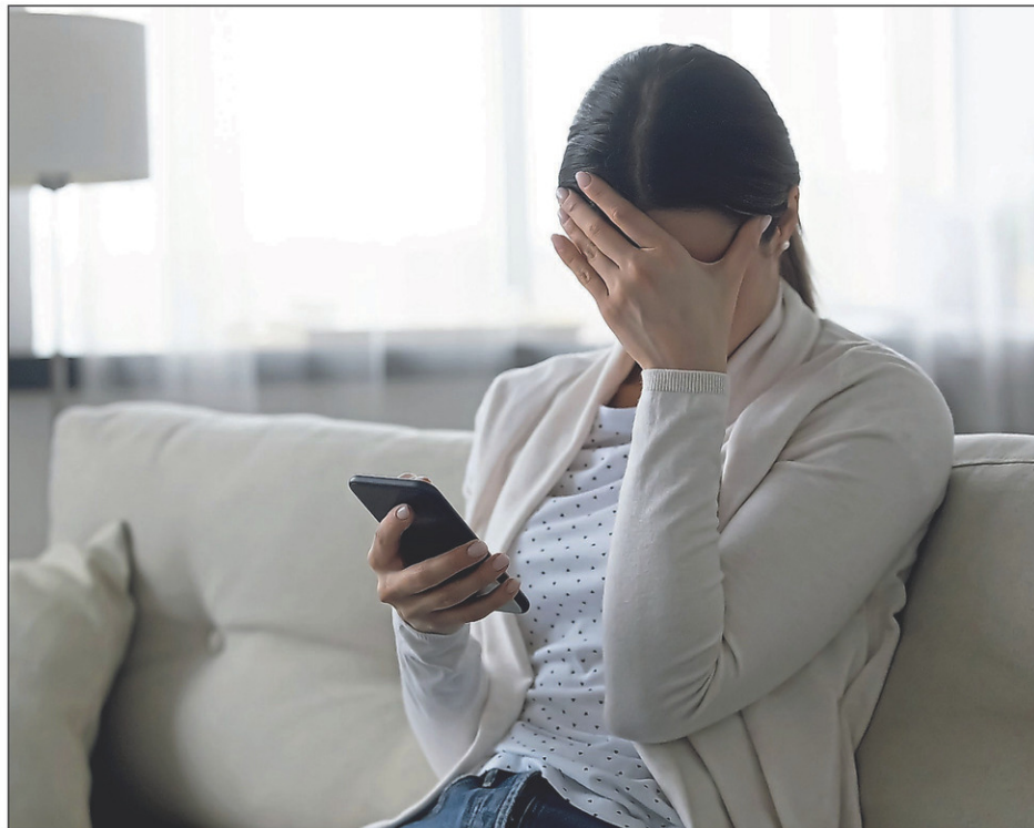
Les tentatives de fraude peuvent arriver de toutes parts : par texto, par courriel, par courrier, sur internet et par téléphone.

Puisque les stratagèmes d'hameçonnage sont multiples, il est impossible de tous les connaître. Il est toutefois possible de s'en