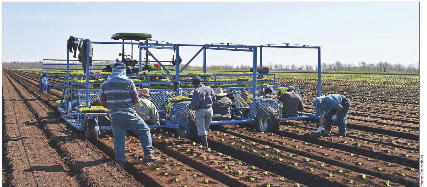
Une somme de 3 M$ pourra être investie annuellement dans des projets de recherche communs à tout le secteur maraîcher.

Les priorités de recherche seront établies par les producteurs par le biais d'un