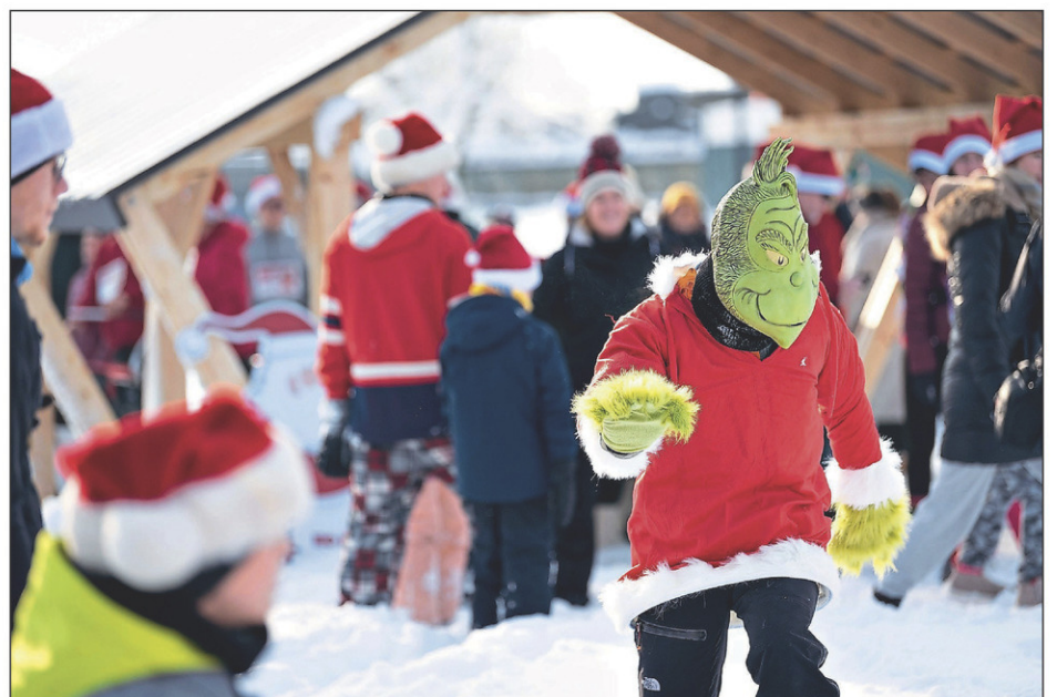
Même le Grincheux a eu envie de s'inscrire à la Course du père Noël.