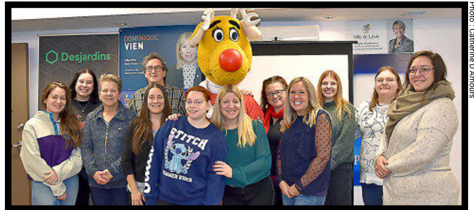
L'équipe d'Alliance Jeunesse Chutes-de-la-Chaudière a été rejointe par la mascotte d'Opération Nez rouge pour le lancement de la campagne.