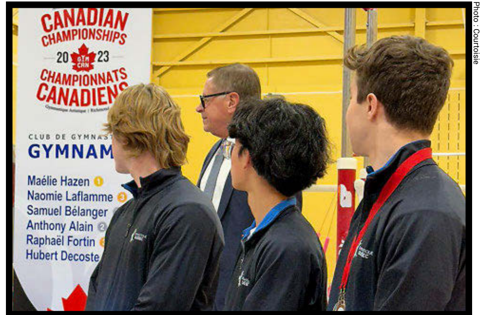
Gymnamic a dévoilé une bannière spéciale pour célébrer ses athlètes qui ont pris part aux récents championnats canadiens.