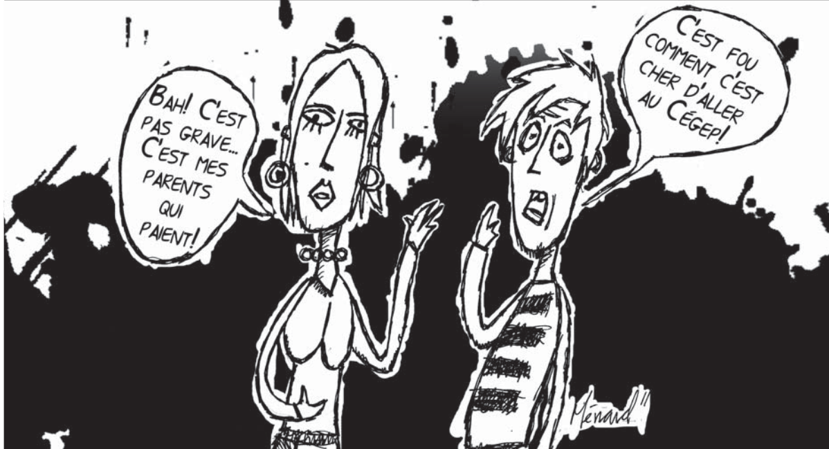
Illustration : Etienne Ménard