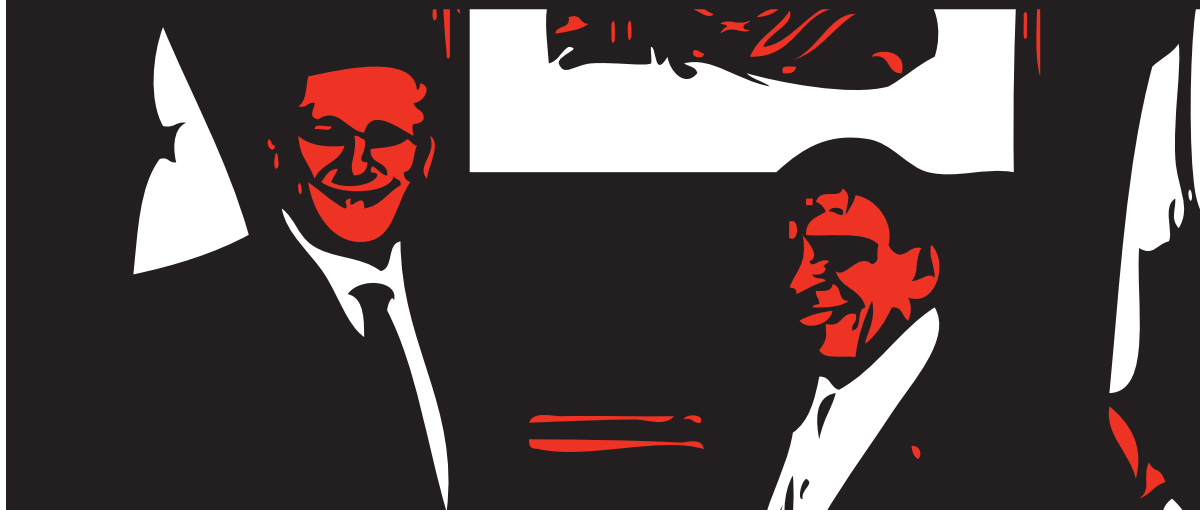
Illustration : Étienne Ménard