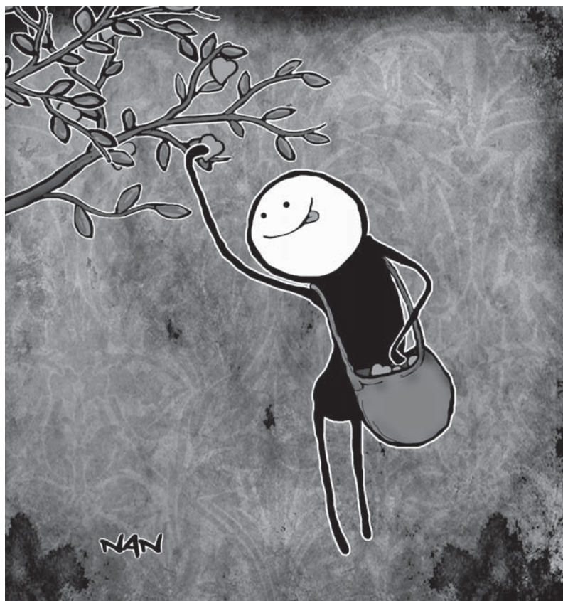
Illustration : Nan

12 septembre. Assemblée Générale Annuelle d'Entrée Libre : À cette occasion, tous sont invités à participer au Bilan annuel, à l'élection du nouveau Conseil d'administration et à la préparation du plan d'action de l'année prochaine. 2012 sera une période de grands bouleversements. Projets de consolidation et d'expansion au menu. Venez participer au succès du Journal! Il est à noter que tous peuvent proposer leur candidature au Conseil d'Administration. 740 rue Cambrai, Sherbrooke, 12 septembre 2011, 18h.