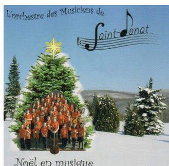
Premier CD de l'Orchestre de Saint-Donat : Noël en musique