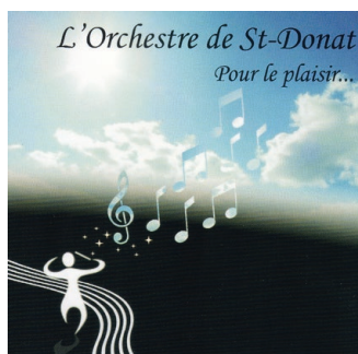
Deuxième CD de l'Orchestre de Saint-Donat : Pour le plaisir

Les membres de l'Orchestre de Saint-Donat partagent avec fierté leur musique avec le public. D'ailleurs, ils se produiront sur la scène du parc des Pionniers le jeudi 13 juillet prochain, dans le cadre de notre programmation estivale Un été tout en culture .