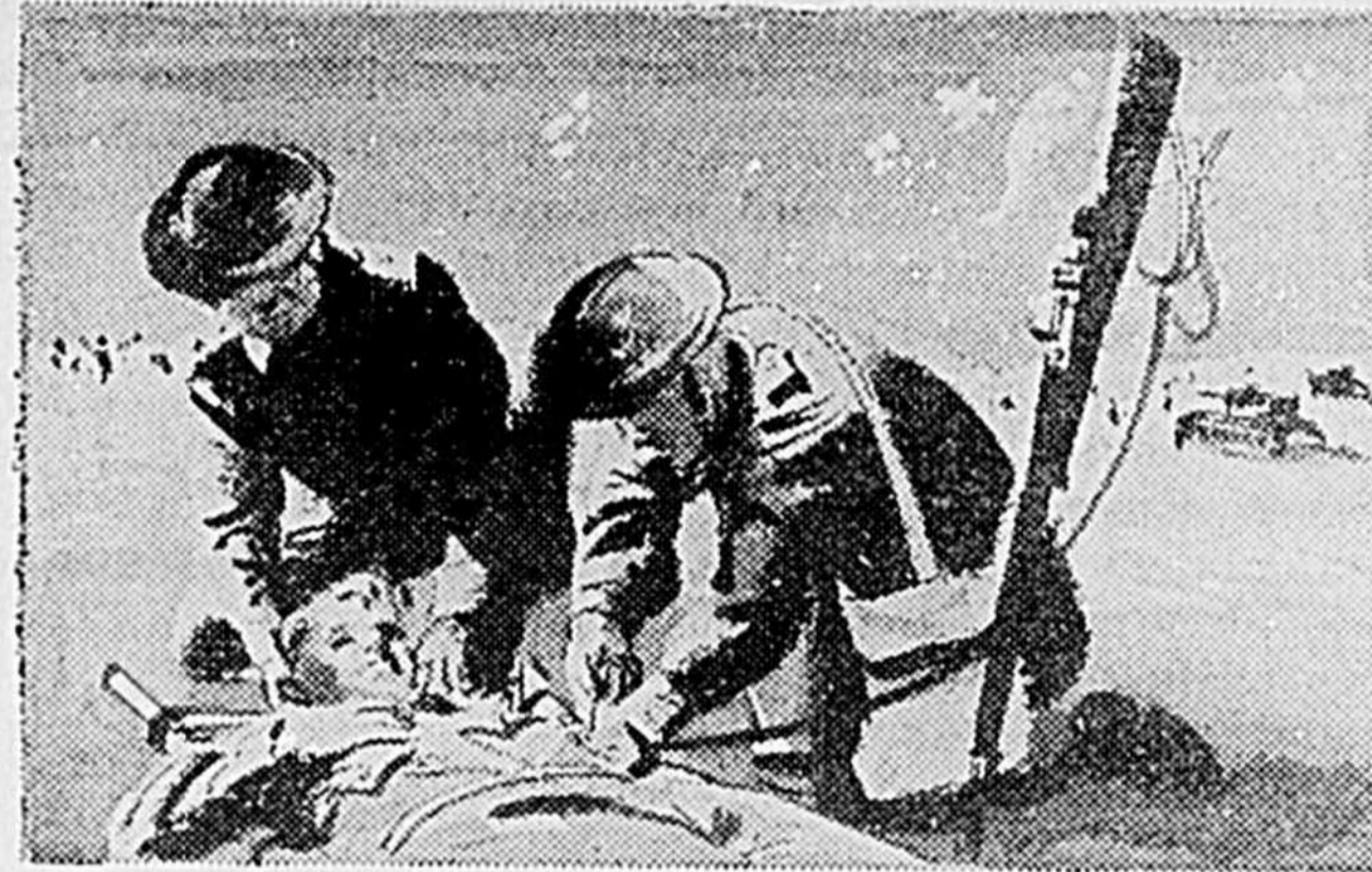
Le sérum sanguin est fait du sang des donneurs bénévoles, recueilli dans les cliniques de la Croix-Rouge. Ce sérum a déjà sauvé des milliers de vies humaines. Il faut de l'argent pour assurer le fonctionnement des cliniques.