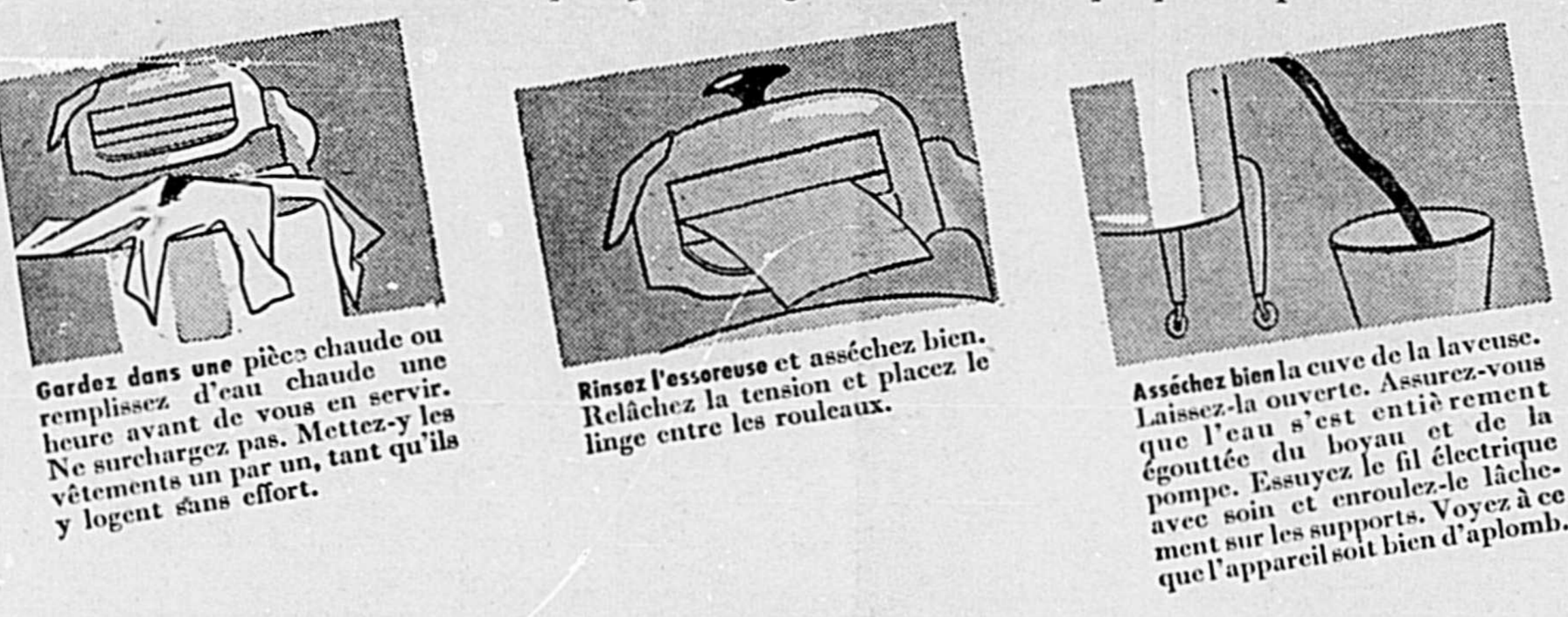
Gardez dans une pièce chaude ou remplissez d'eau chaude une heure avant de vous en servir. Ne surechargez pas. Mettez-y les vêtements un par un, tant qu'ils y logent sans effort.