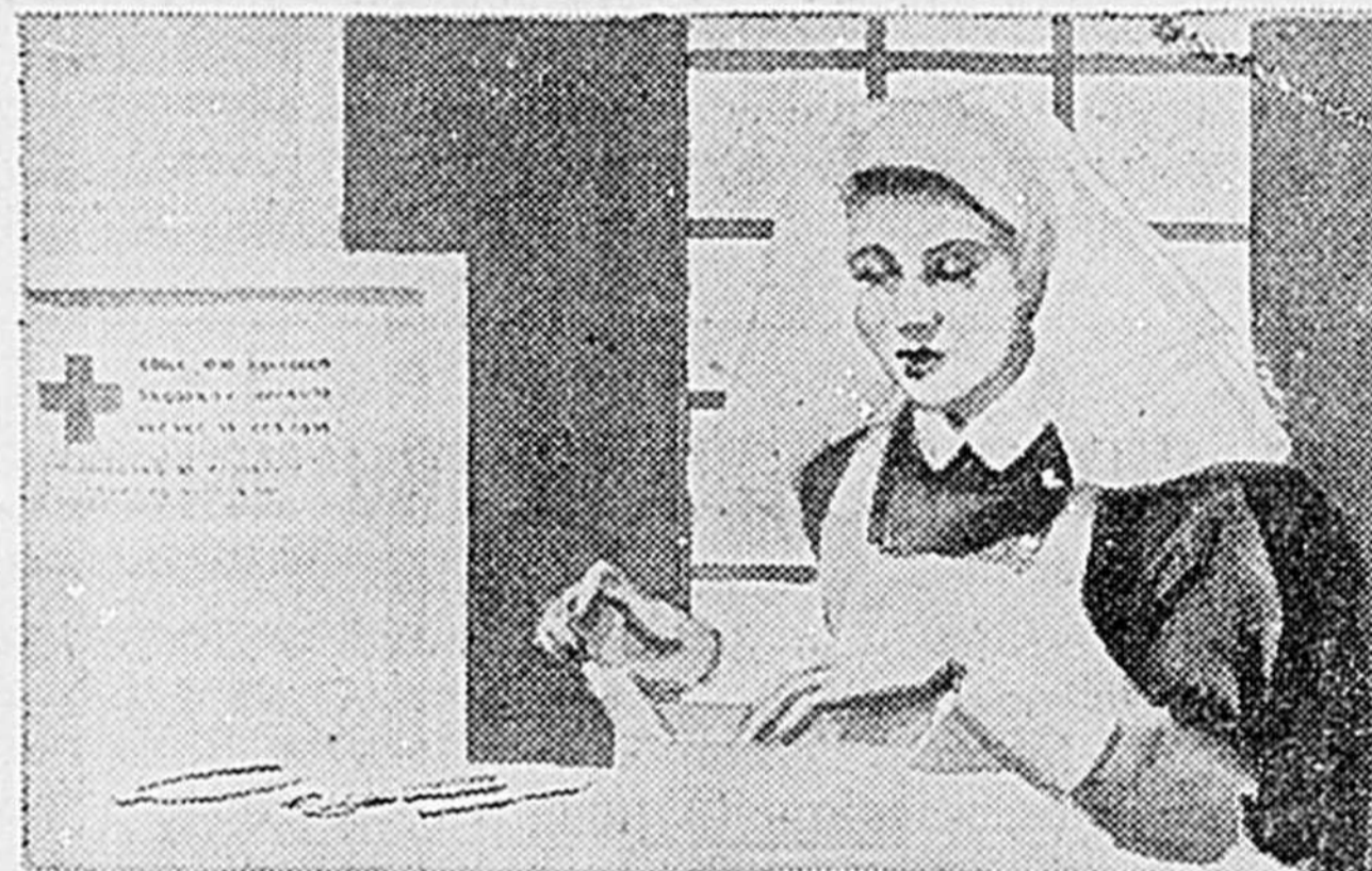
Il faut que les médicaments, les instruments de chirurgie et les pansements continuent d'affluer aux endroits où ils sont nécessaires. C'est le moment de souscrire afin de secourir nos gars outre-mer.