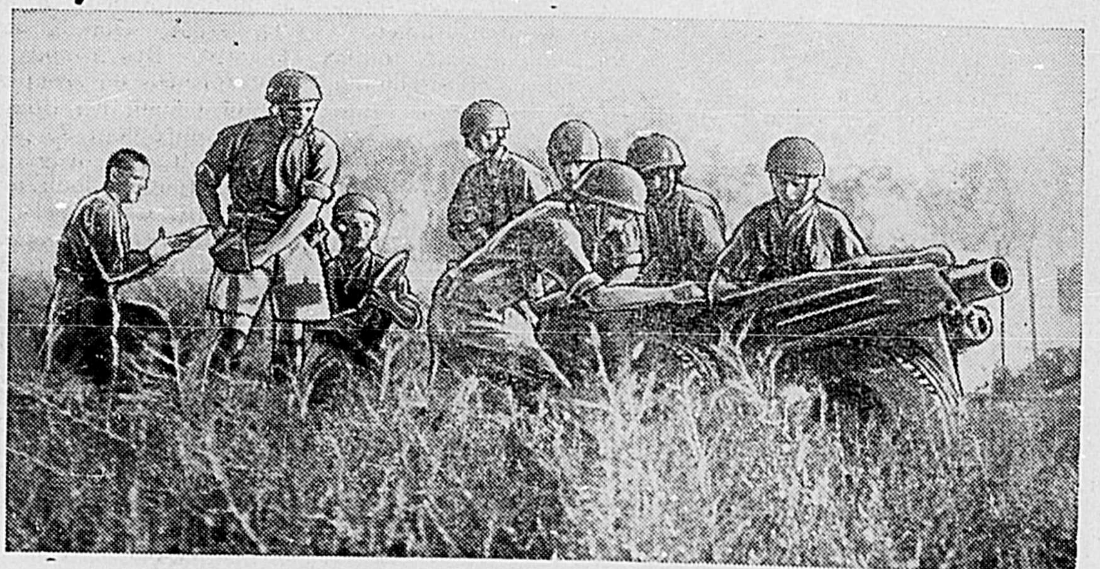
PATRIQUE DE L'ARTILLERIE AEROPORTEE BRITANNIQUE Régiment d'artillerie légère de l'air de l'Artillerie royale, d'une division aéroportée britannique, s'exerçant au tir et protégeant de ses canons les troupes d'une brigade de parachutistes. La gravure représente l'Artillerie aéroportée "en action".