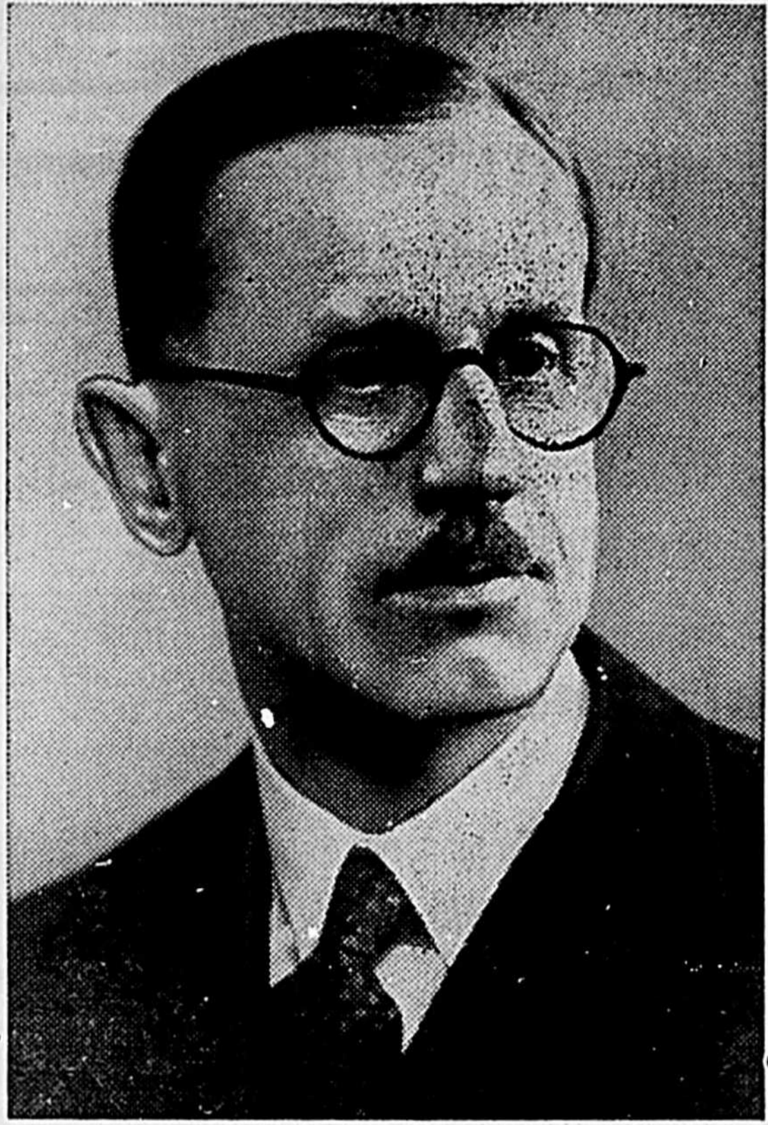
La gravure représente Sir William Strang, membre britannique du nouveau Comité consultatif européen. Le Roi l'a récemment créé chevalier.