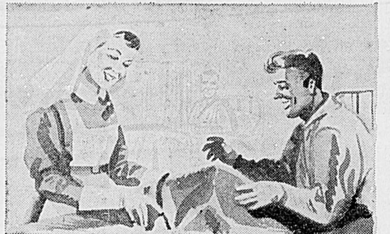
Les hôpitaux ont besoin de gardes-malades diplômées. Il faut aussi des ambulances et du matériel de toute sorte. Les infirmières de la Croix-Rouge, vraies sœurs de Charité qui soignent nos blessés, attendent de vous les moyens de poursuivre leur oeuvre humanitaire. Donnez généreusement.