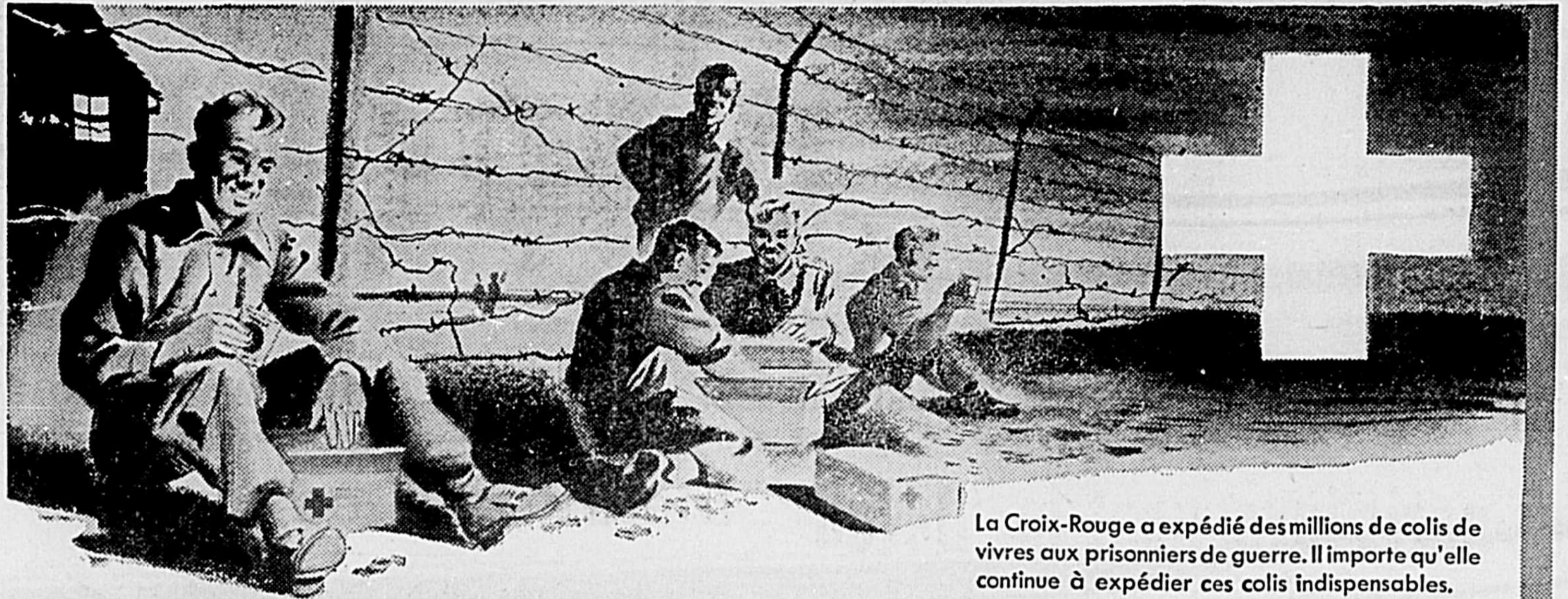
La Croix-Rouge a expédié des millions de colis de vivres aux prisonniers de guerre. Il importe qu'elle continue à expédier ces colis indispensables.

Londres — Durant la dernière guerre, la Grande Bretagne avait 5,000,000 hommes sur le champ de bataille. En ce qui concerne l'armée, la marine et l'aviation,