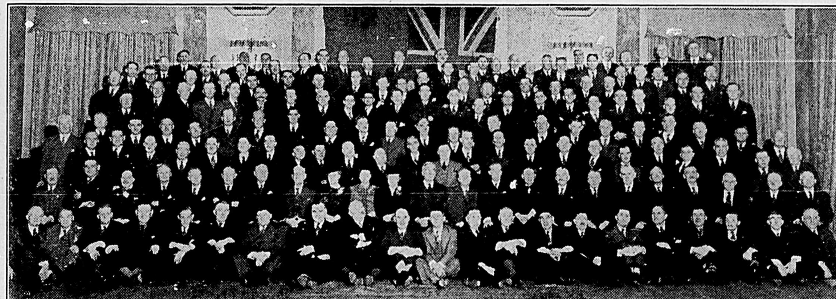
Cette photographie a été prise au cours d'un banquet offert par la compagnie aux employés de The National Breweries Limited ayant vingt-cinq années de service ou plus à son emploi. A cette occasion on a jeté les bases d'un club dont le nom sera "Club d'un quart de siècle". Deux cent dix employés avec une moyenne de trente-deux années et quatre mois de service — un total de 6,792 années — ont la durée de service requise pour faire partie de ce club.

— Allons prendre un dernier verre; "elle" a encore soif!