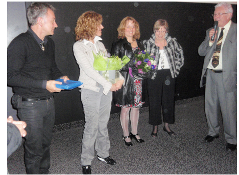
CINÉMA DU QUÉBEC À NANTES