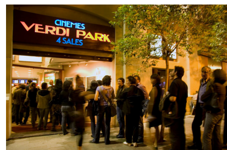
LE CINÉMA VERDI PARK À BARCELONE POUR L'ÉVÉNEMENT CINÉMA DU QUÉBEC À BARCELONE