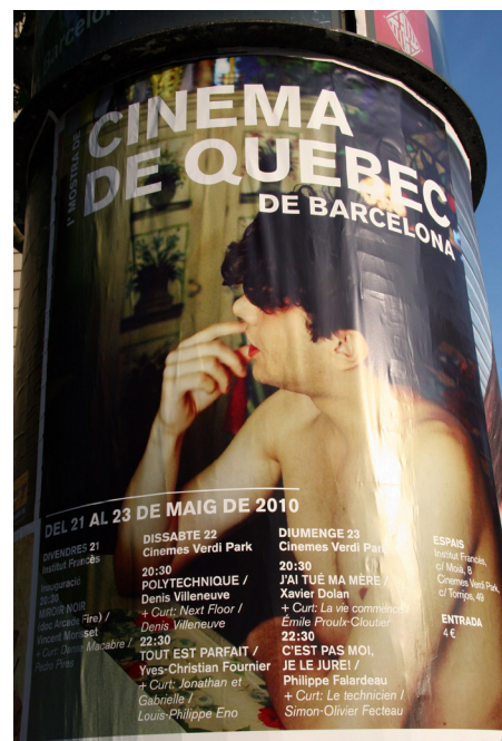
AFFICHE CINÉMA DU QUÉBEC À BARCELONE