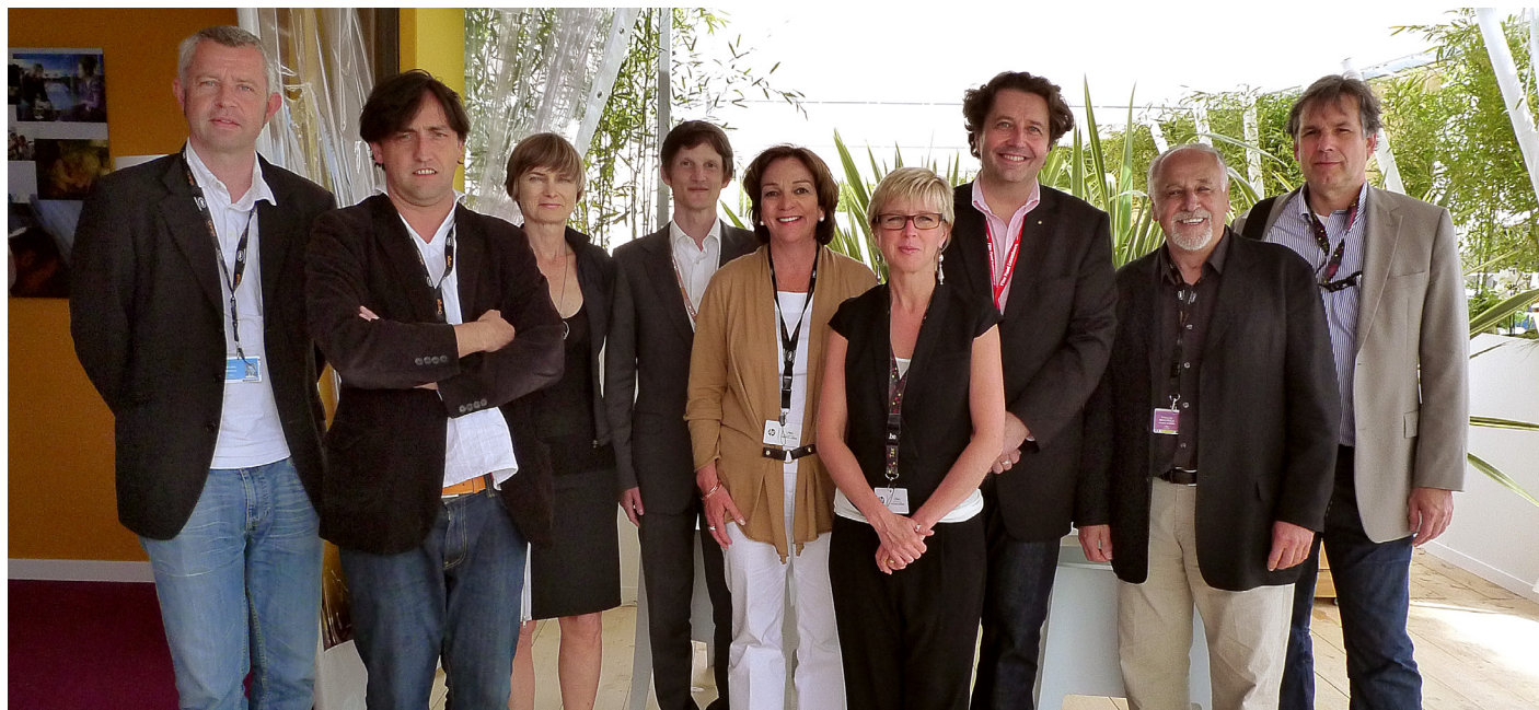
RENCONTRE DES PARTENAIRES FRANCOPHONES À CANNES - FRANCE, SUISSE, LUXEMBOURG, BELGIQUE, CANADA