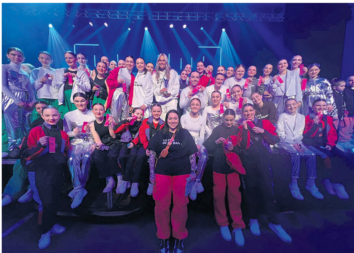
Les élèves de la Cité de la Danse de Val d'Or ont opté pour de larges sourires en fin de semaine passée.

Comme si glaner des breloques ne suffisait pas, les numéros de C.Devotion et C.Passion 2.0 se sont taillés une place parmi les plus grands en prenant part au Gala des étoiles, synonyme de finale de la compétition. Le duo Sarabelle et Elissa, C.Respect ainsi que C.Passion se sont avérés être les coups de cœur des juges. « On ressent