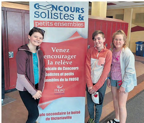
Les élèves étaient visiblement heureux de participer à cette expérience musicale.

«Pour nous c'était notre retour après 2 ans, ça faisait plusieurs années qu'on y allait à Victoriaville avec des élèves de secondaire 1 à 5, mais avec la pandémie c'était en