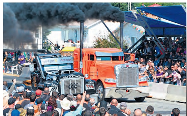
La foire du camionneur de Barraute a un projet ambitieux dans les cartons : une piste en circuit fermé.