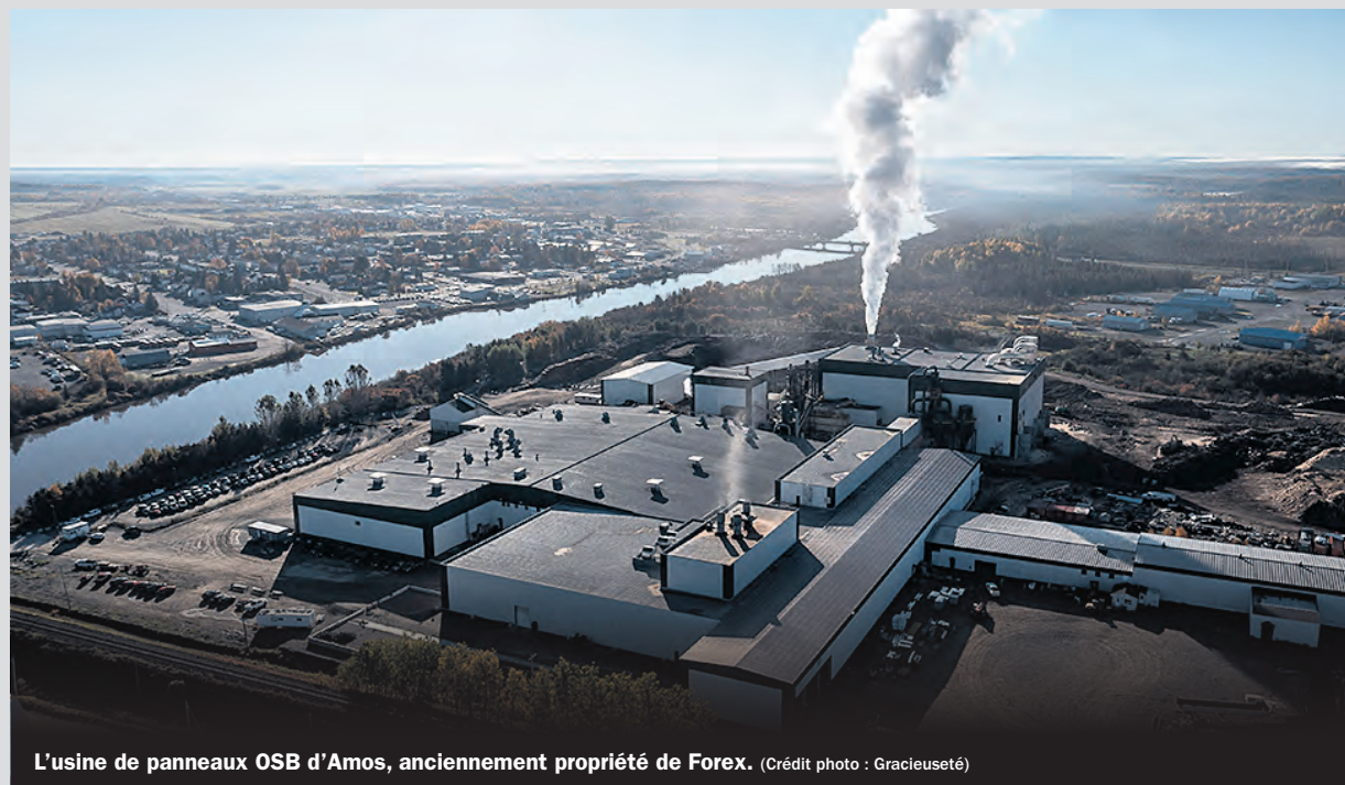
L'usine de panneaux OSB d'Amos, anciennement propriété de Forex.

« Il est certain que nous allons nous entretenir avec les travailleurs afin d'assurer la continuité des activités à l'usine d'Amos. Nos autres usines sont également affiliées au syndicat Unifor et nous voulons poursuivre notre relation avec eux et nous assurer que nous allons tous dans la même direction », a-t-il confirmé.