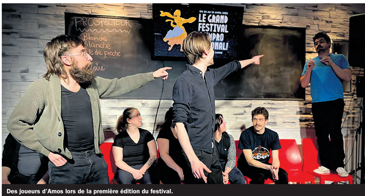
Des joueurs d'Amos lors de la première édition du festival.

Le vendredi 19 mai, c'est la Soirée d'Improvisation de Rouyn-Noranda (SIR-N) et l'Improvisatorium du Professeur Lebel qui vous attendent pour une soirée sous la théma-