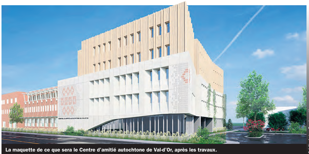
La maquette de ce que sera le Centre d'amitié autochtone de Val-d'Or, après les travaux.