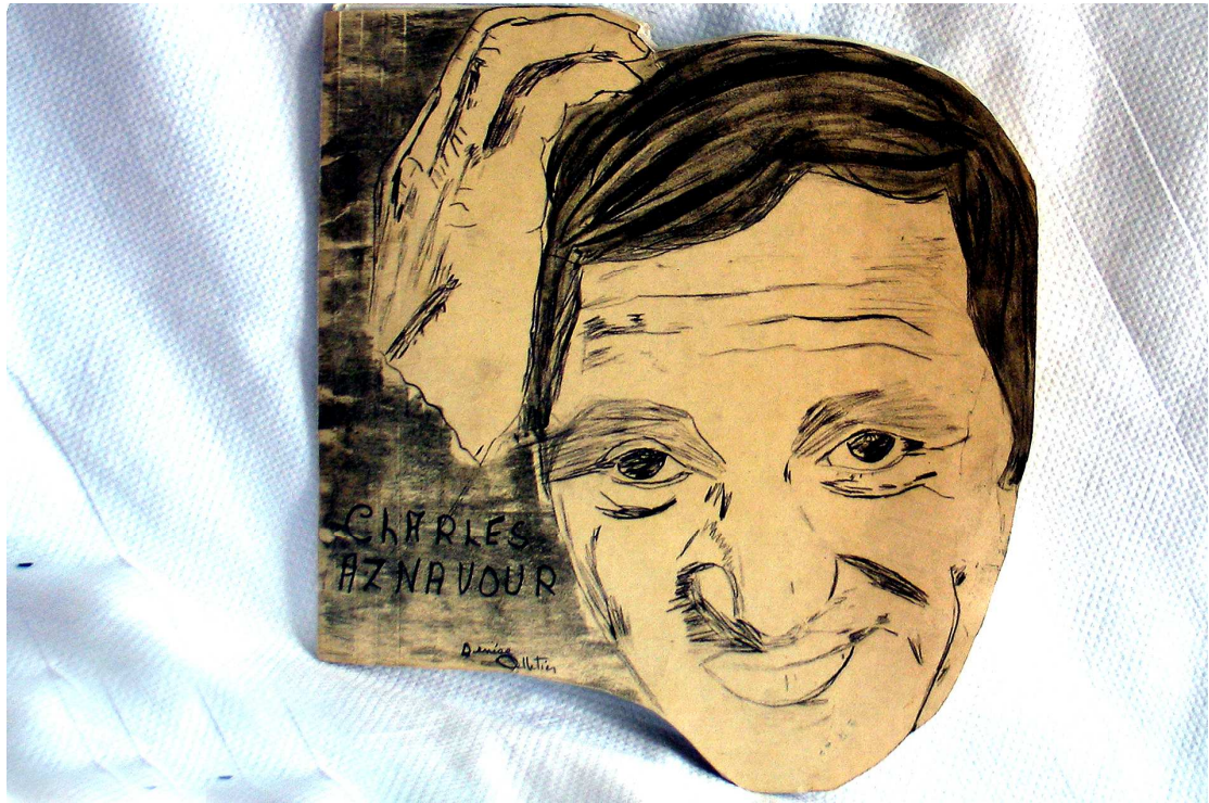
Charles Aznavour (Dessin au crayon de plomb, 21 cm. x 23 cm.) Par Denise Pelletier, 1967