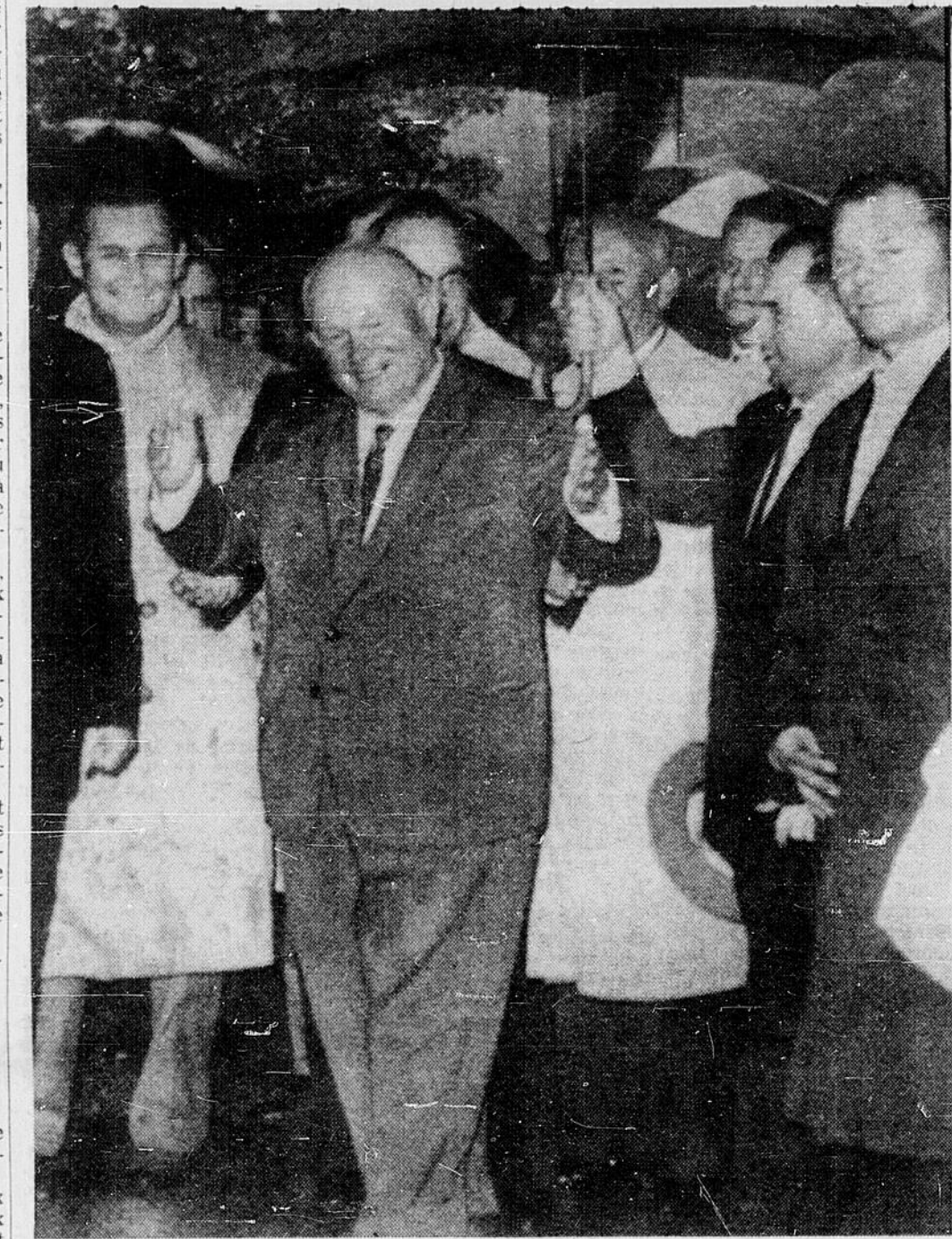
KHROUCHTCHEV a été accueilli par la pluie et les huées de la foule à son arrivée à New York pour assister à la réunion de l'Assemblée générale des Nations unies.