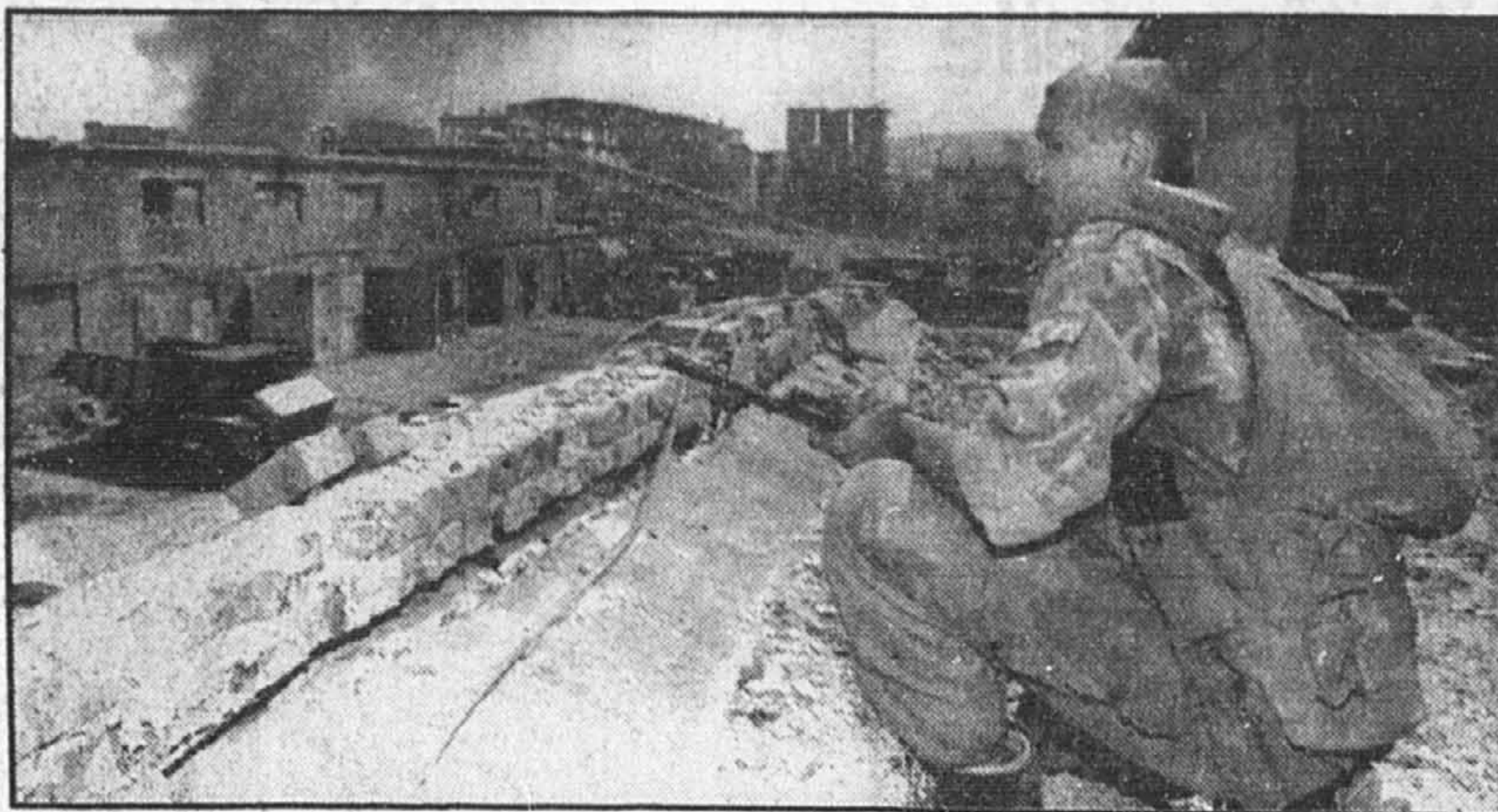
Un soldat russe fait le guet aux abords d'une usine de ciment à Chiri-Yourt pendant un affrontement entre Russes et Tchétchènes.