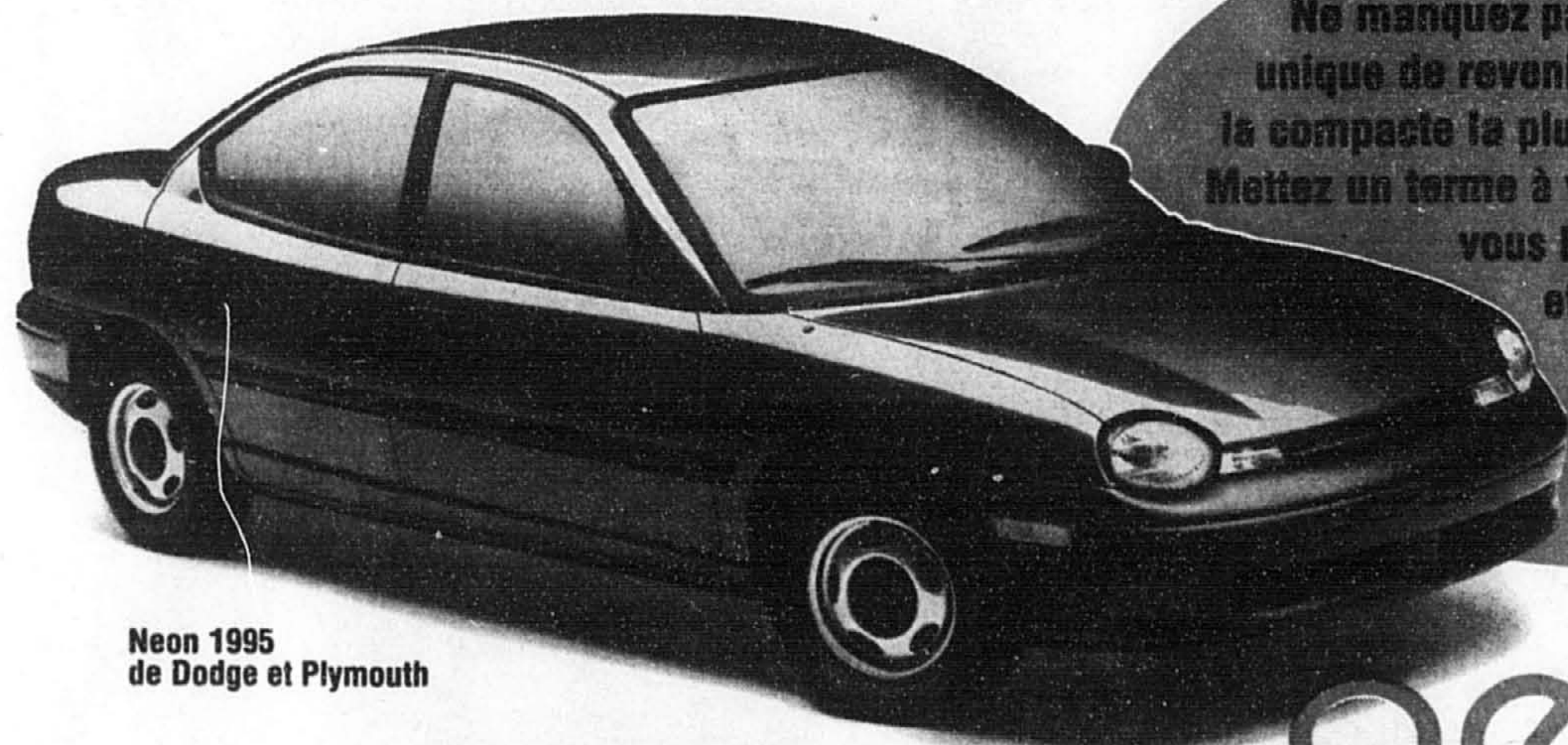
Neon 1995 de Dodge et Plymouth

Ne manquez pas cette occasion unique de revenir à la maison avec la compacte la plus populaire au pays. Mettez un terme à vos recherches et offrez-vous la « Voiture de l'année » et la « Meilleure voiture économique » selon l'AJAC!