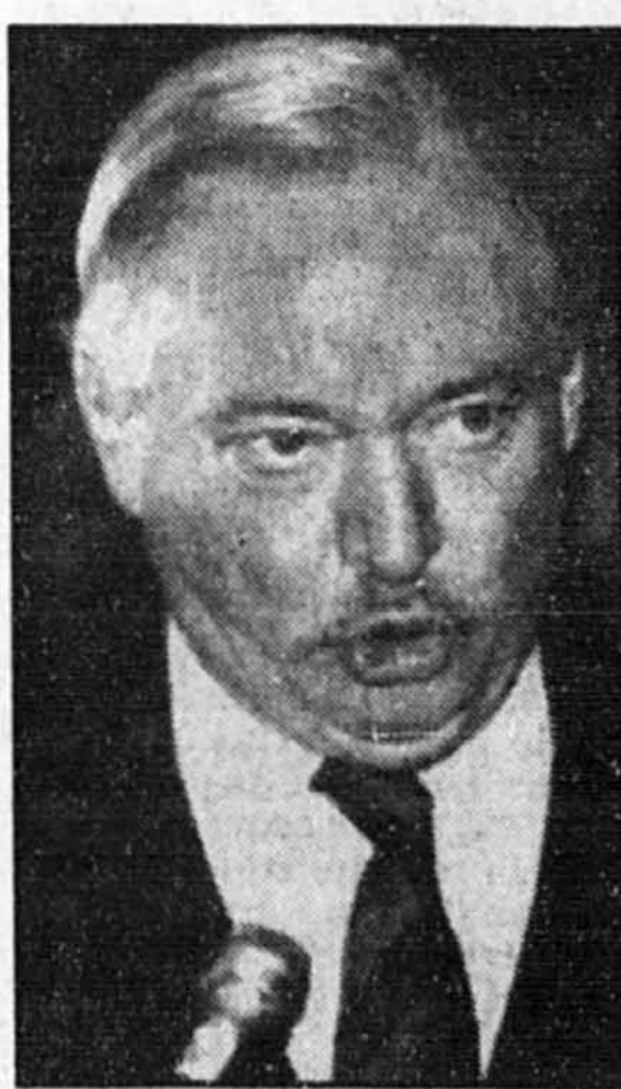
Jacques Parizeau tional du PQ en fin de semaine.

Les nombreuses allusions faites depuis quelques semaines par M. Parizeau à la propriété des médias écrits québécois à eu des échos hier à l'Assemblée nationale. Une résolution sur cette question devrait d'ailleurs être débattue au Conseil na-