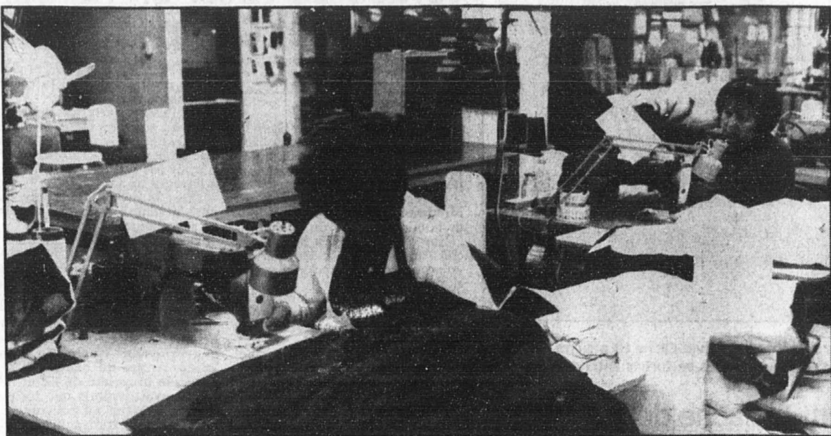
Un des objectifs de la Marche des femmes est d'obtenir le relèvement du salaire minimum à 8,15 $ l'heure.