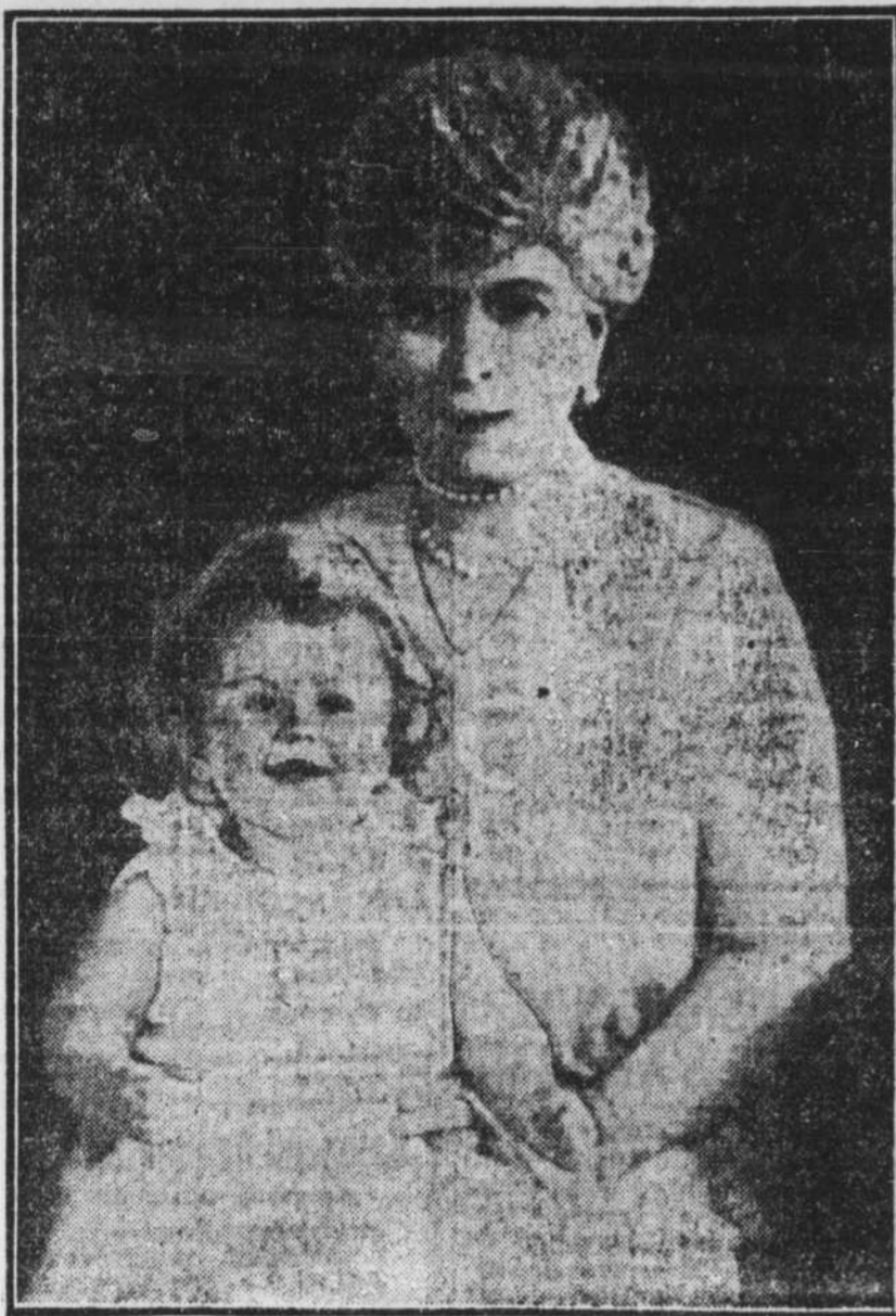
L'on voit ici Sa Majesté la reine Marie, avec sa petite-fille, la princesse Elisabeth.