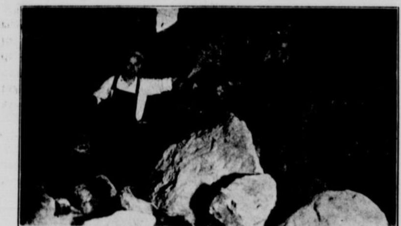
Après l'explosion de la mine

Tous les habitués de la Maison savent qu'une belle salle de gymnase a été construite, sous l'édifice de la Chapelle. Pour donner pendant à cette salle, spacieuse, on creuse au sous-sol de l'édifice adjacent et quand l'emplacement sera libre, on construira une salle et celle-ci adjointe à celle qui existe déjà pourra loger de 1200 à 1500 personnes assises.