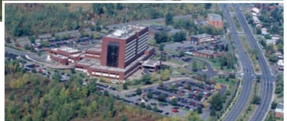
Centre hospitalier Pierre-Boucher

On retrouve à Longueuil un pôle universitaire offrant des programmes adaptés aux intérêts des 50 ans et plus, des parcs régionaux et de nombreux espaces, des aménagements urbains favorisant la concentration de commerces et de services spécialisés à proximité des complexes résidentiels. À ces nouveaux milieux, s'ajoutent d'autres services sur le territoire, soit : deux hôpitaux majeurs, l'un disposant d'un centre ambulatoire (Pierre-Boucher) et l'autre étant un hôpital universitaire comprenant un centre de radio-oncologie (Charles-LeMoine).