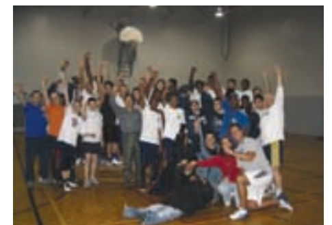
Étudiants et policiers, tous vainqueurs! Des activités sportives et sociales étaient au rendez-vous.

Ce match fait partie d'une série d'initiatives entreprises ces dernières années par le Service de police dans le but de renforcer une relation de confiance avec les jeunes. On se souvient que l'an dernier, différents matches de hockey-ball avaient été organisés dans plusieurs écoles de la ville.