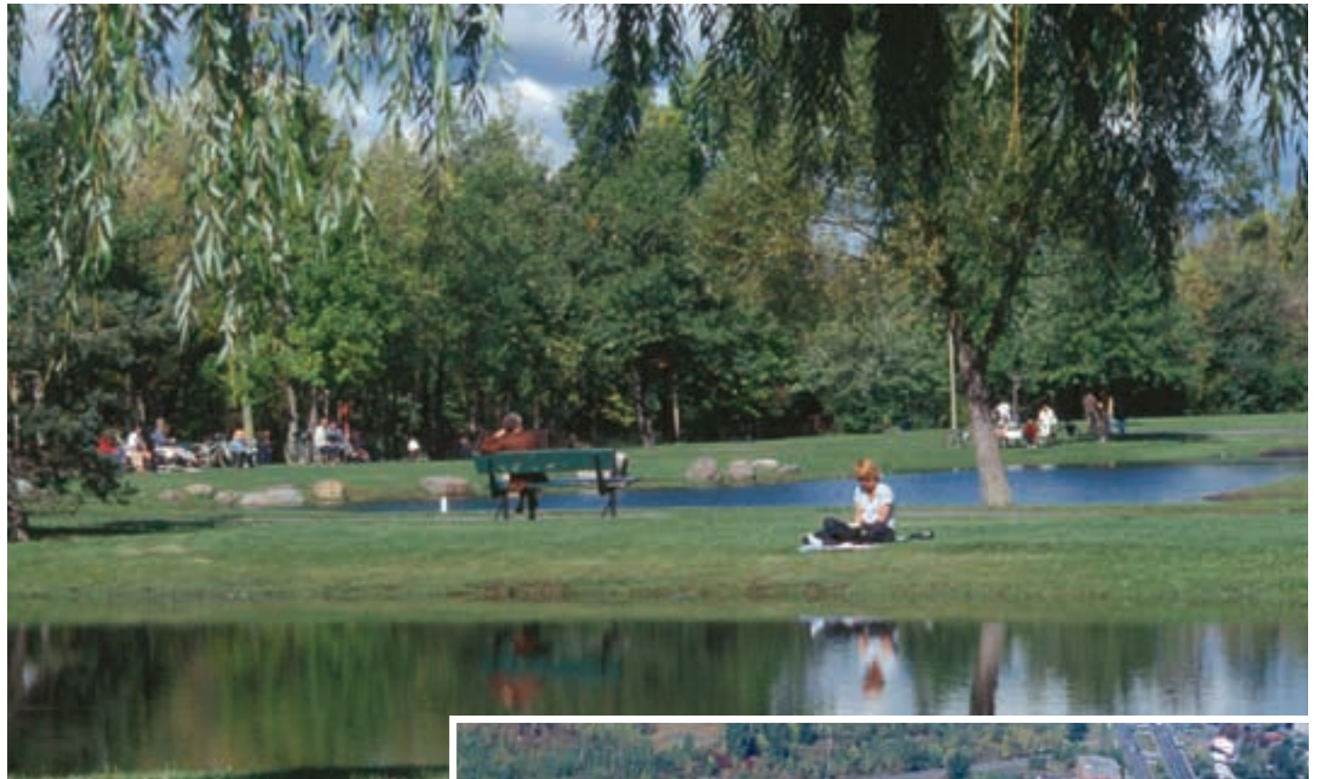
Parc régional de Longueuil

En effet, Longueuil accorde une grande importance à l'environnement et aux milieux naturels dans ses projets de développement. Le secteur situé à proximité du Parc régional de Longueuil est un exemple de nouveau secteur bâti selon des principes de développement intégré. On y retrouve un complexe de plus de 200 logements situé à la fois près du parc, des commerces et des services, du centre hospitalier Pierre-Boucher et des cliniques médicales spécialisées.