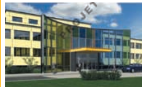
Futur hôtel de ville Les travaux ont débuté