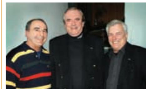
Scrutin référendaire à Le Moyne

Les citoyens choisissent l'arrondissement du Vieux-Longueuil