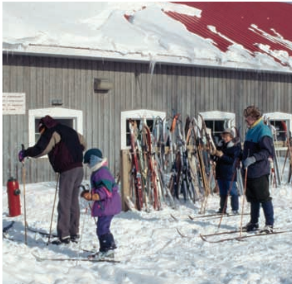
Le relais, situé au 1798, chemin du Lac

Partout sur le territoire de Longueuil, il existe de nombreux parcs où l'on peut patiner et marcher l'hiver. Renseignez-vous auprès du Service du loisir, de la culture et de la vie communautaire de votre arrondissement pour connaître les sites les plus près de chez vous.