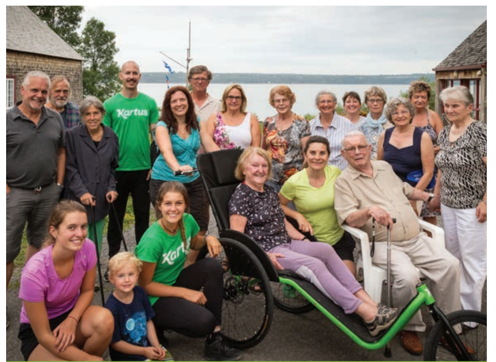
La chaise Kartus permet à une personne à mobilité réduite de faire équipe avec un coureur pour diverses activités.

vie des aînés en offrant aux entreprises une nouvelle porte d'entrée pour rejoindre les 55 ans et plus. De l'autre, il y a Kartus, créateur de la chaise en question. Partageant des objectifs similaires, l'association des deux entreprises dans ce projet était donc des plus naturelles. Leur arrêt au Parc maritime s'inscrivait dans le cadre d'une grande tournée amorcée au début de l'été. Ayant pour objectif de faire découvrir la chaise Kartus, le dynamique duo comptait visiter ainsi une trentaine de résidences pour aînés.