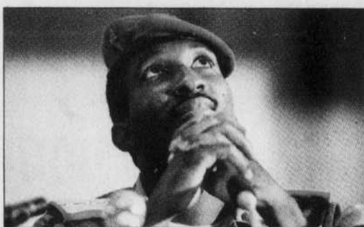
Thomas Sankara en 1986

Souvent qualifié de «Che Guevara africain», Thomas Sankara est reconnu comme l'un des plus grands révolutionnaires de l'Afrique moderne, admiré par la jeunesse du continent au même titre que Nelson Mandela ou Patrice Lumumba. Ce charismatique leader panafricaniste a réussi, en près de quatre ans de