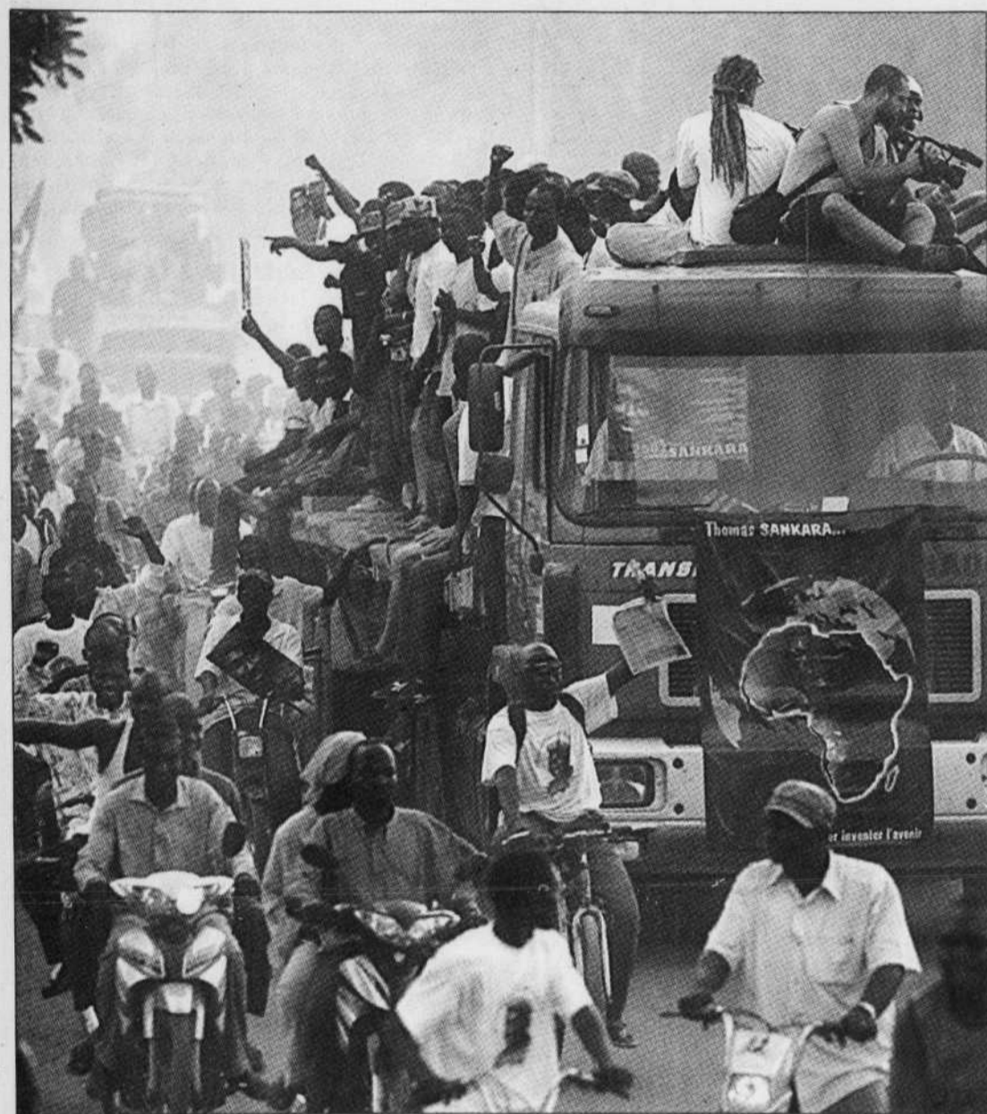
Célébrations en l'honneur de Thomas Sankara dans les rues de Ouagadougou, hier, vingt ans après l'assassinat du héros burkinabé.