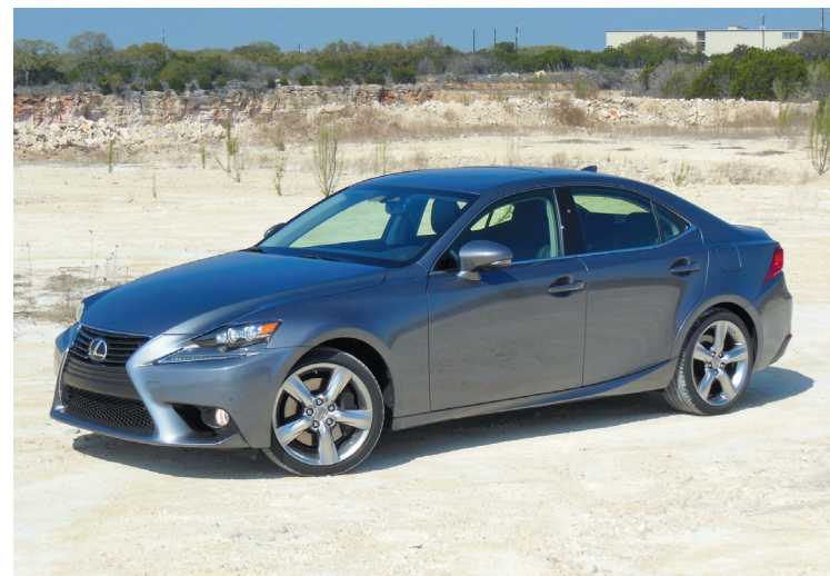
Les IS 250 et 350 (photo) régulières proposent un équilibre confort-comportement qui frôle la perfection.