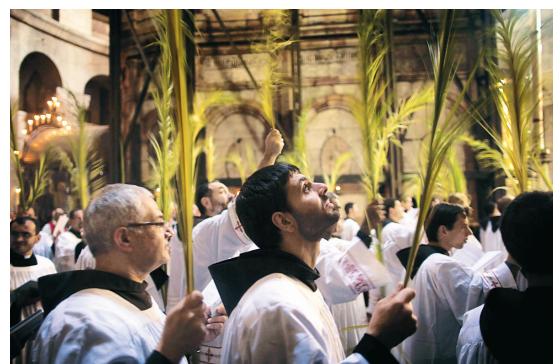
Des catholiques de l'Église romaine soulignent le dimanche des Rameaux à Jérusalem. Les chrétiens palestiniens ont aussi participé aux cérémonies.

redaction@ledevoir.com Jean-Claude Leclerc enseigne le journalisme à l'Université de Montréal.