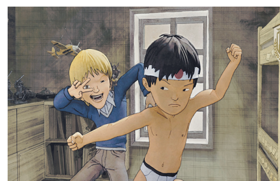
Cette première incursion dans le septième art tintera le troisième volume de Couleur de peau: miel .

dis toujours que, devant ma feuille à dessin, je suis Dieu. C'est vrai: j'ai un espace de liberté complet. Le cinéma, en revanche, implique des compromis. On ne fait pas un film tout seul. Ça se fait avec d'autres. Surtout dans le cas présent, puisqu'il s'agit d'une coréalisation [avec Laurent Boileau]. J'ai donc dû apprendre à travailler avec une équipe. C'est inhérent à la fabrication d'un film. »