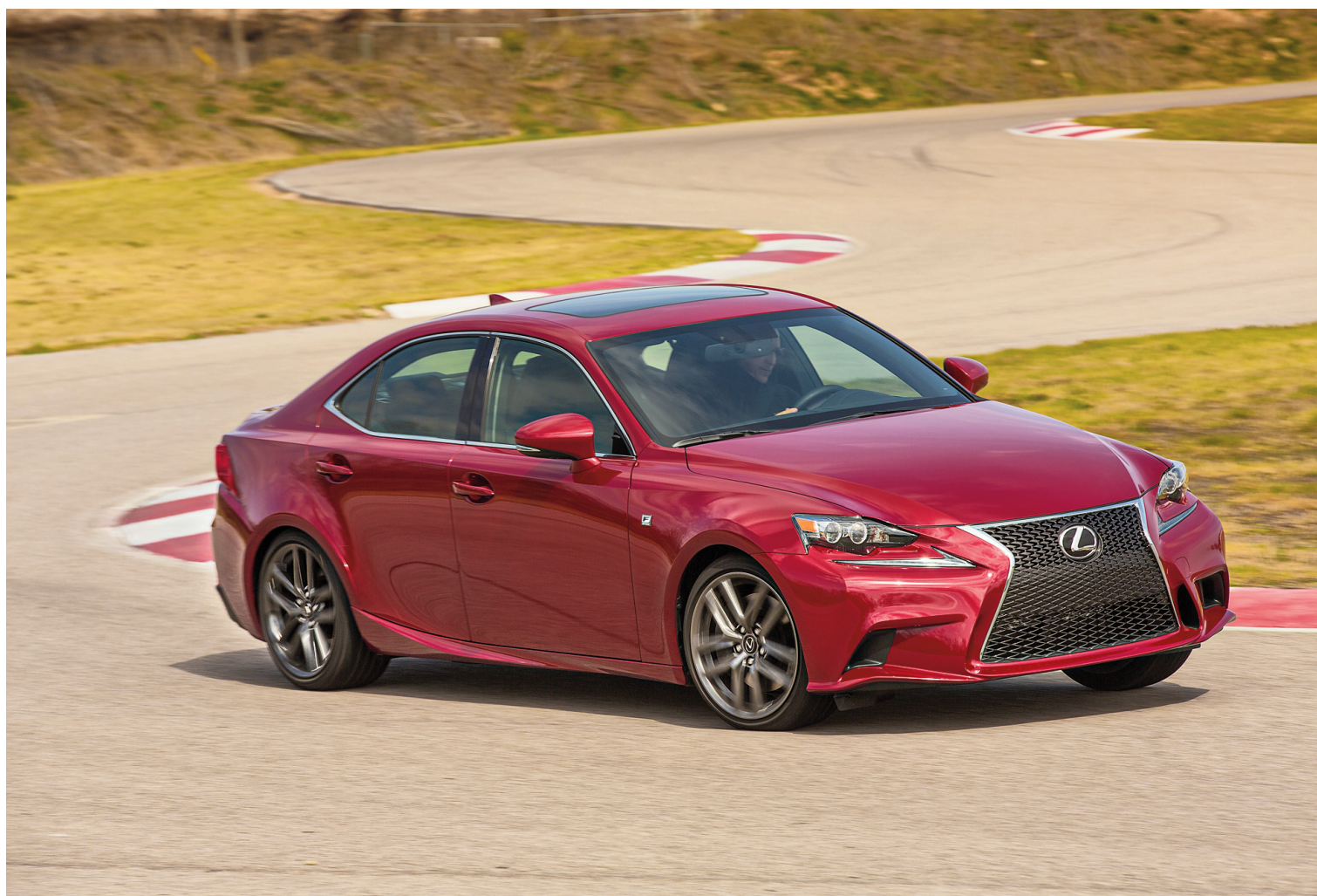
La silhouette de la Lexus IS 2014 reprend les grandes lignes de l'ancien modèle, mais elle a été épurée.

Les améliorations ne s'arrêtent pas là. L'habitacle de l'IS est plus spacieux — l'emplacement a été allongé, la largeur augmentée — et plus confortable, gracieuseté de sièges parfaitement sculptés et bien enveloppants. Vous les apprécierez autant lors de longs trajets que dans une enfilade de virages serrés. Le centre de gravité ayant été abaissé pour maximiser les prestations routières, l'assise est plus basse: