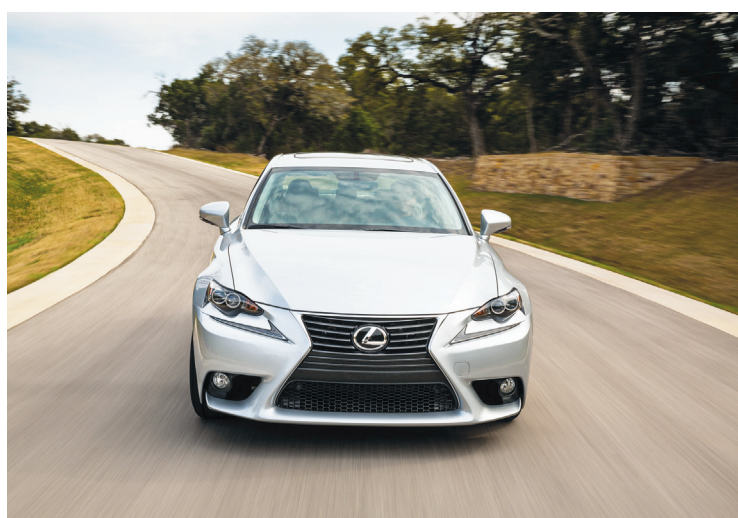
Lexus a bâti sa réputation sur la qualité globale de ses véhicules, ce qui inclut notamment une finition soignée et une construction impeccable.