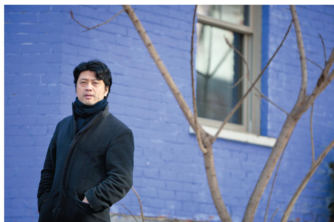
Adopté en Corée du Sud par un couple de Belges, Jung a vécu une crise identitaire engendrée par sa double singularité: asiatique parmi les Caucasiens, adopté parmi les biologiques.