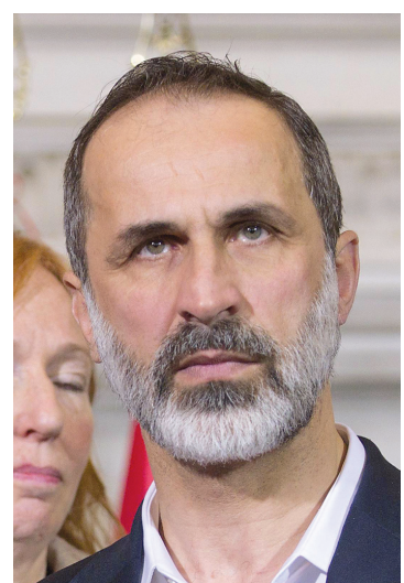
Le chef de l'opposition syrienne, Ahmed Moaz al-Khatib

« Ces deux dernières années, nous avons été égorgés par un régime d'une brutalité sans précédent, alors que le monde nous observait. Toutes les destructions, la détention de dizaines de milliers de personnes, l'exil forcé de centaines de milliers n'ont pas suffi pour que la communauté internationale prenne une déci-