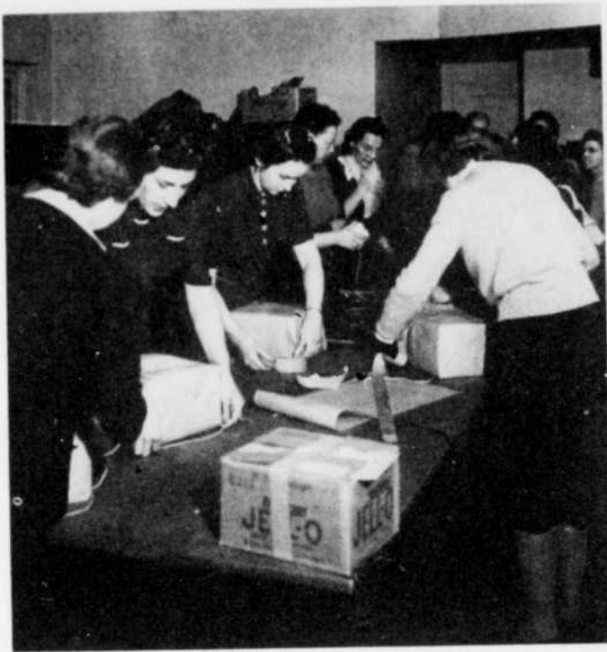
Voici la reproduction d'une photographie prise lors d'une séance du Club de Service de Guerre de l'Aluminium. Une trentaine de membres assistaient à cette assemblée du 23 octobre.

A date, 38 de nos anciens employés ont reçu, par l'intermédiaire de notre club, un colis contenant des douceurs destinées à leur apporter un peu de reconfort. La semaine dernière, le club a réussi à faire un nouvel envoi de 38 colis qui parviendront à leur destination pour Noël. A partir du mois de janvier, le club sera en mesure de faire parvenir 18 colis par mois à nos soldats.