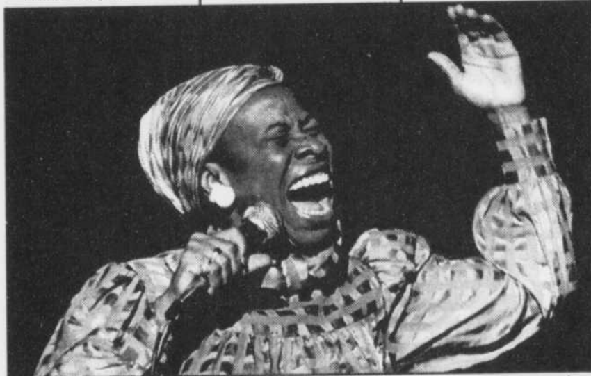
Betty Carter en concert au FESTIVAL INTERNATIONAL DE JAZZ DE MONTRÉAL, dimanche, 22h05, à Radio-Québec.