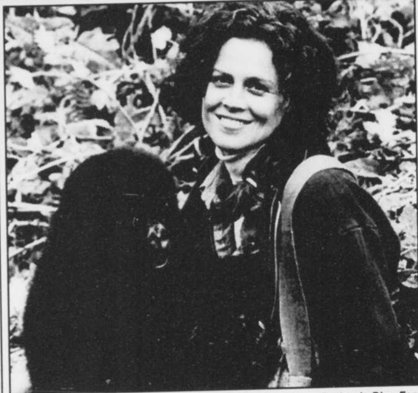
Sigourney Weaver dans le rôle principal de l'histoire extraordinaire de Dian Fossey, « Gorilles dans la brume », aux GRANDS FILMS, vendredi, 20h, R.-C.