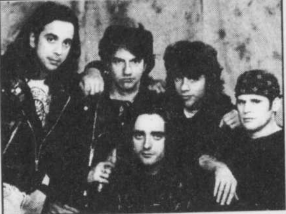
Un concert hydro-acoustique avec Vilain Pingouin à CONCERT INTIME, samedi, 20h, à MusiquePlus.