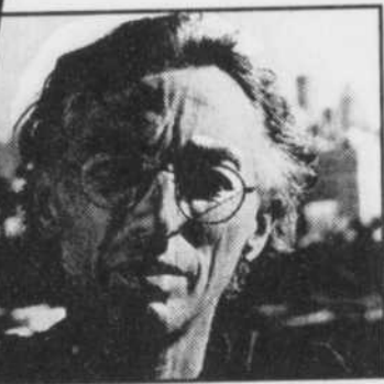
Quinze minutes inoubliables en compagnie de Richard Desjardins, à CHAMP LIBRE, dimanche, 19h35, à TV5.