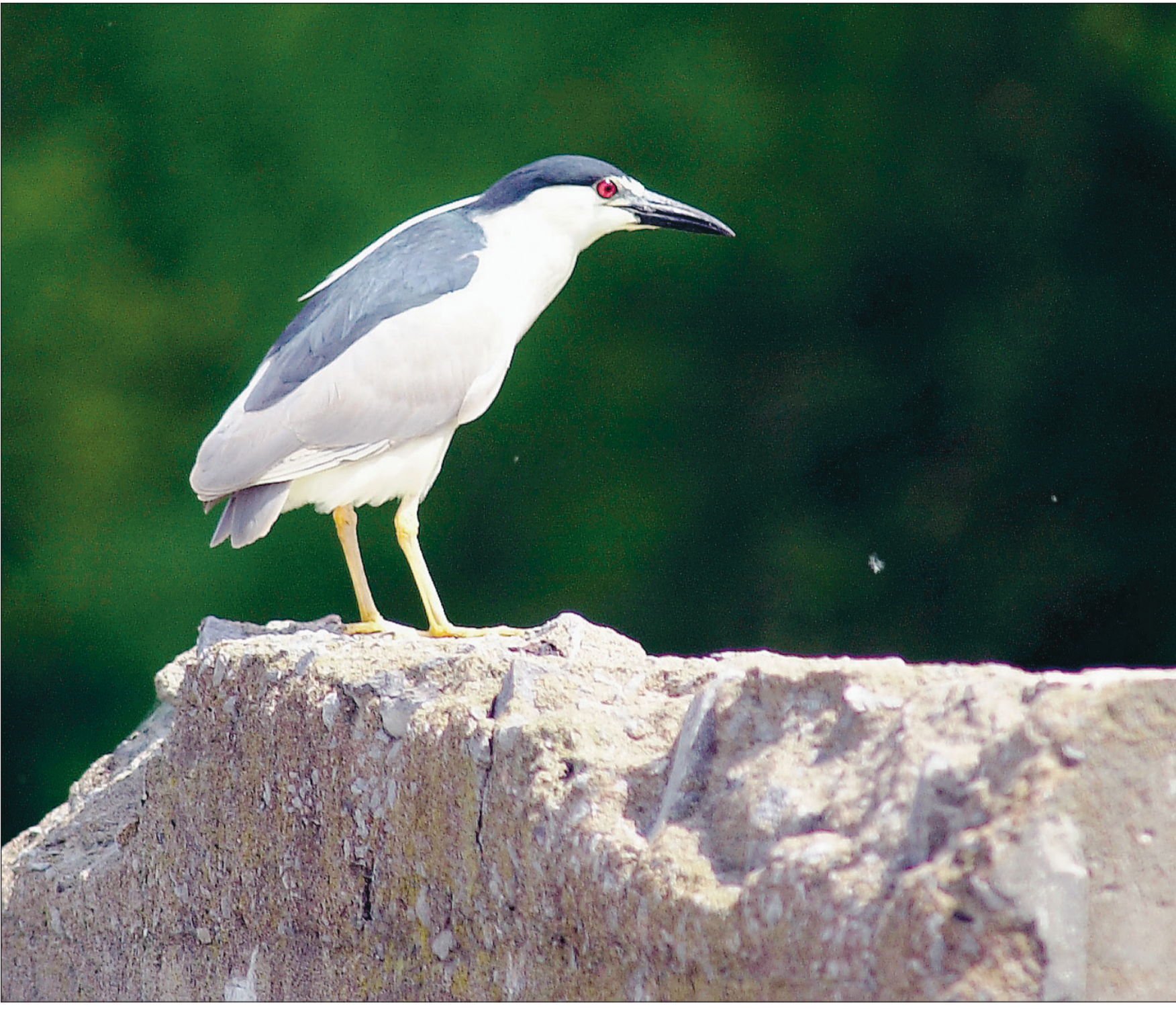
Le bihoreau gris n'est pas un oiseau exclusivement nocturne. Celui-ci a été photographié au parc-nature de l'Île-de-la-Visitation.