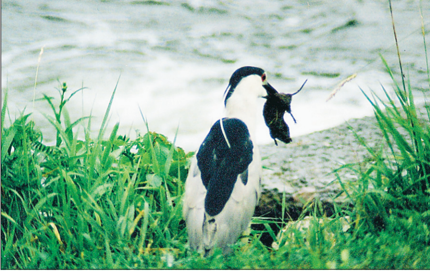
Le régime alimentaire du « corbeau de nuit » est très varié. Il n'hésite pas à capturer de grosses proies comme ce bébé rat musqué bien grassouillet.

Scène intéressante aussi sur un petit lac à baie de la Tour. J'ai pu observer un plongeon huard adulte qui plongeait sans cesse pour capturer des poissons qu'il offrait ensuite aux deux petits, à tour de rôle. Puis, de la mer très proche, est arrivé le mâle (ou la femelle), lançant son cri caractéristique dès son amerrissage et se mettant immédiatement en chasse pour nourrir à son tour ses rejetons. C'est la première fois que j'assistais à une scène semblable. Un beau moment.