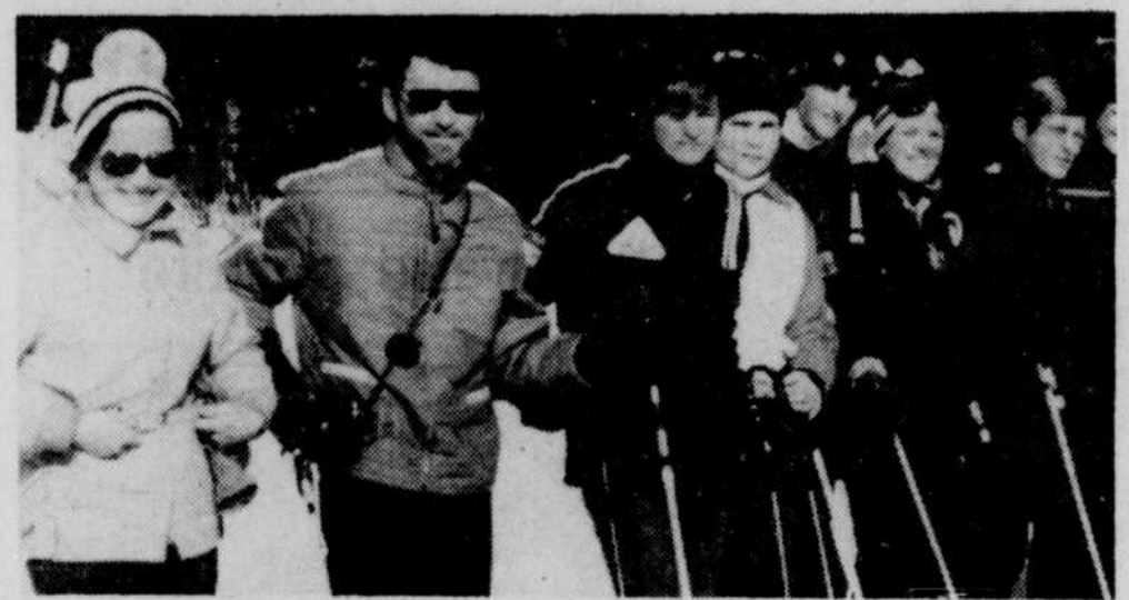
Quelques étudiants de l'école régionale de Richmond et des professeurs se rendront à une semaine d'éducation en plein air à Ste-Agathe, du 12 au 17 mars courant.

En résumé cette semaine d'éducation spéciale sera à la fois une cure de santé, un laboratoire des sciences naturelles et une initiation à un sport. En attendant le départ, les étudiants de même que les professeurs, tous aussi emballés les uns que les autres, se préparent impatientement à cette grande excursion.