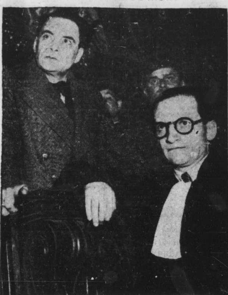
Le Dr Marcel Petiot, les yeux hagards, entend prononcer contre lui la sentence de mort. Il a été trouvé coupable du meurtre de 27 personnes, à Paris.