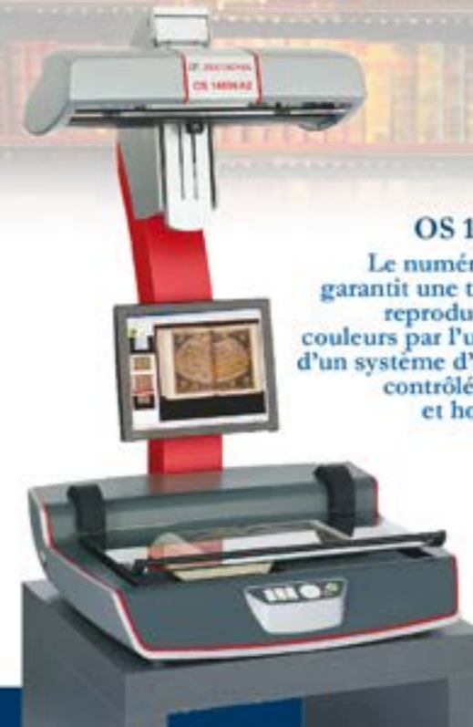
OS 14000 A2 Le numériseur qui garantit une très haute reproduction des couleurs par l'utilisation d'un système d'éclairage contrôlé, régulier et homogène.