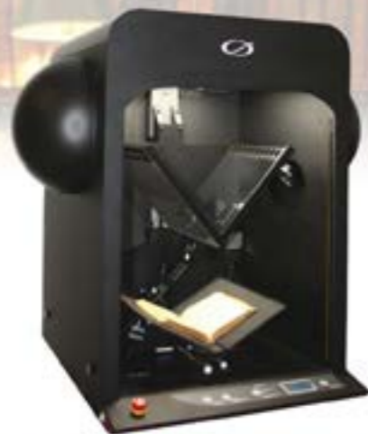
QIDENUS RBS SEMI A1 Le numériseur automatique ou semi-automatique à ouverture partielle qui permet une dématérialisation sécuritaire des livres anciens et fragiles