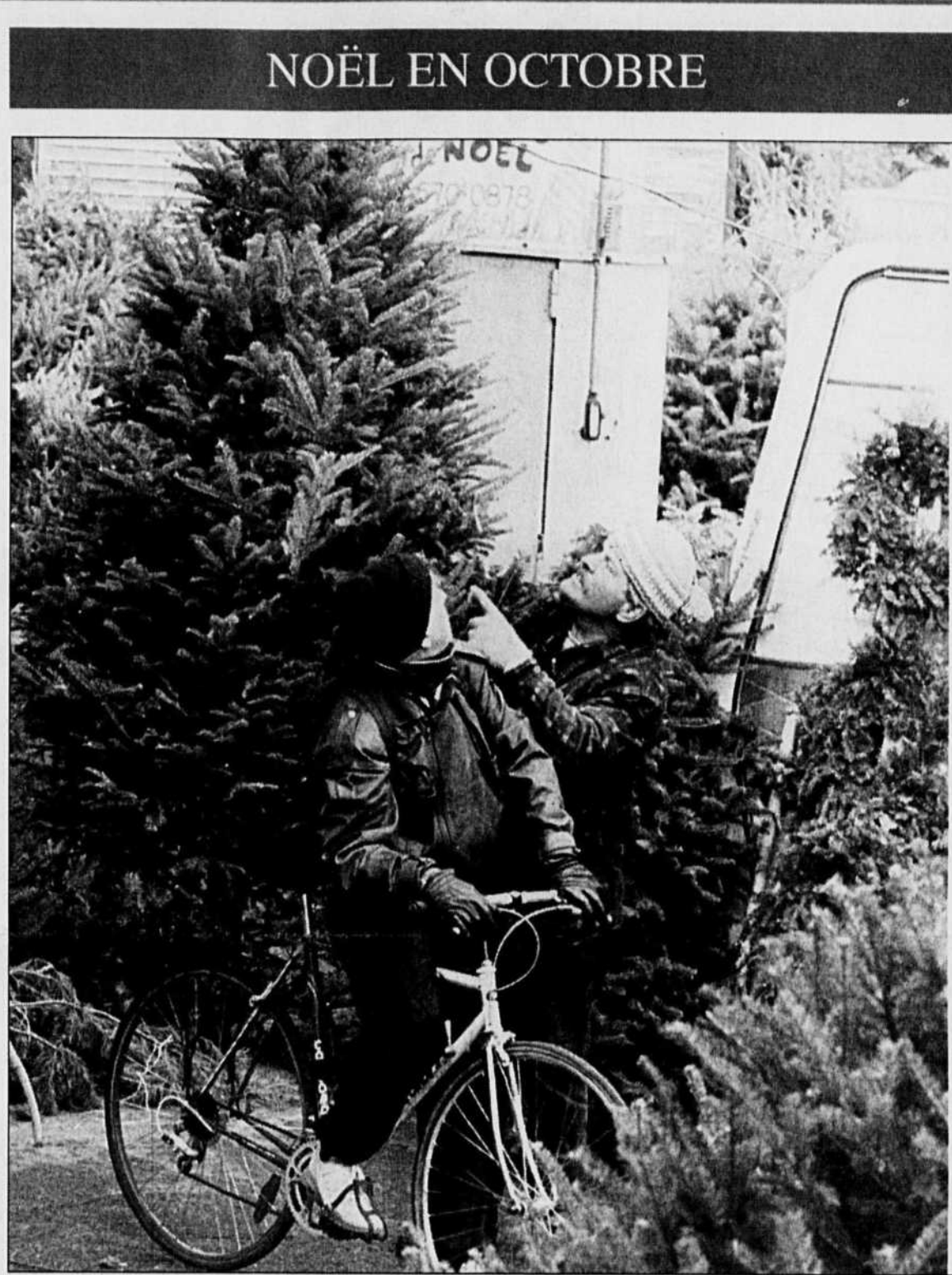
NOËL EN OCTOBRE

Les sapins se vendent mal cette année, disent les commerçants installés aux quatre coins de la ville: le temps doux donne l'impression aux gens qu'ils sont toujours en octobre. Même verdict dans les commerces de détail: les Montréalais tardent à acheter leurs cadeaux. Vivement la neige et la froidure.