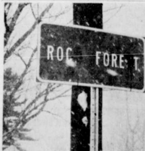
QUI EST LE CORRECTEUR? — Qui donc s'est permis de refranchir l'appellation de la municipalité de ROCK FOREST pour rebaptiser l'endroit en ROC FORET? S'agit-il d'amis de la langue française, de séparatistes déterminés, ou simplement de vandales en mal de publicité?

Tel est le projet d'entente que la Commission des écoles catholiques de Sherbrooke soumettra à la régionale, avant de lui passer les locaux dont cette dernière a tant besoin pour le secondaire.