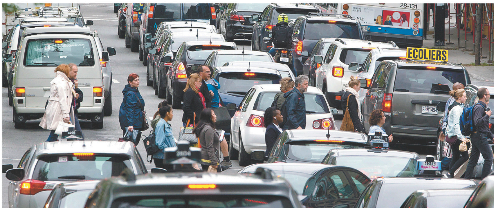
L'OCDE a conclu que c'est dans le secteur du transport que le déficit de tarification est le moins grand, soit 21%.