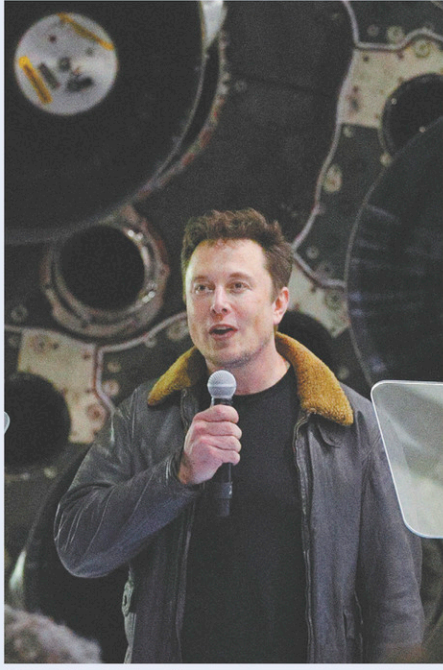
Elon Musk, lundi