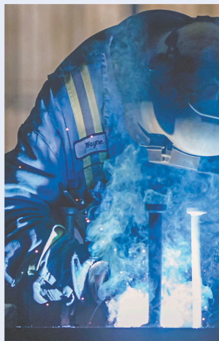
DERRYL DYCK LA PRESSE CANADIENNE