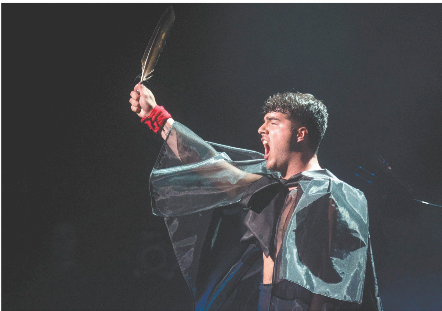
Jeremy Dutcher en performance sur scène pendant le gala du prix Polaris lundi soir à Toronto.