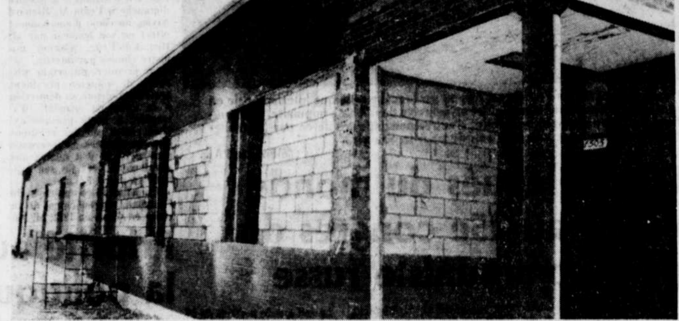
C'est dans cette ancienne usine en voie de transformation que le Centre des services sociaux du Centre du Québec installera ses bureaux à compter du mois de mai. D'autres bureaux seront également aménagés dans cet espace de 18,000 pieds carrés.

dans un espace de 8,000 pieds carrés ayant façade sur le boulevard St-Joseph. Un autre section de même grandeur sera convertie en bureaux et proposés à la location; alors que 2,000 pieds de plancher serviront aux services communautaires des locataires. Ces travaux de rénovation constituent un investissement de l'ordre de $200,000 et sont effectués par la firme Deshaies et Raymond, d'après les plans des architectes Blais et Camirand. On sait que l'usine Eastern Paper Box est maintenant installée, depuis trois ans environ, sur le boulevard Lemire.