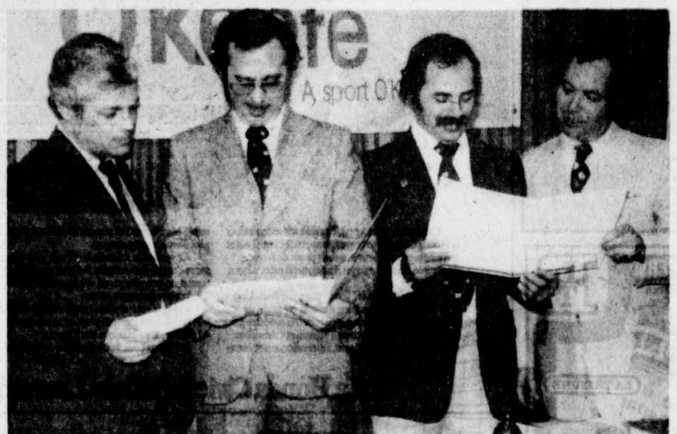
Le Festival Atomes de Victoriaville se déroulera les 2, 3 et 4 avril prochain au Pavillon Jean Béliveau. C'est ce qu'ont annoncé les organisateurs en fin de

morque pour l'en déloger. Il fut aussitôt transporté à l'Hôtel-Dieu d'Arthabaska par les ambulanciers de la Maison Marcoux et Dion de Victoriaville. Il a été impossible de connaître la nature exacte de ses blessures. Ses dommages matériels s'élevaient à environ $3.500.