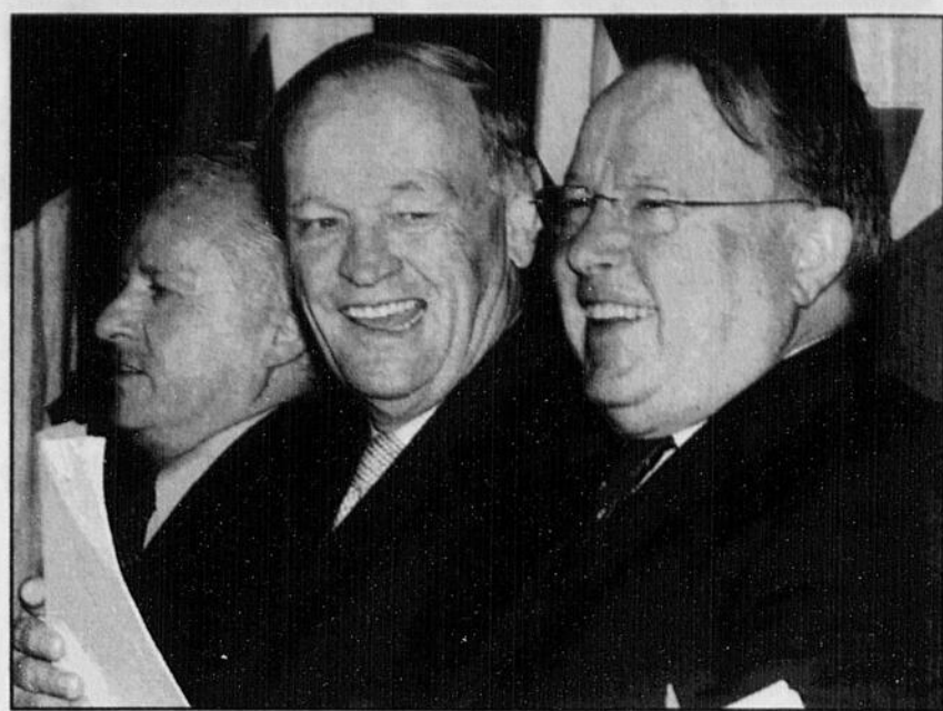
Les premiers ministres Jean Chrétien et Bernard Landry étaient tout sourire, hier, à l'annonce de l'élargissement de la 175 qui mène de Québec au Saguenay.