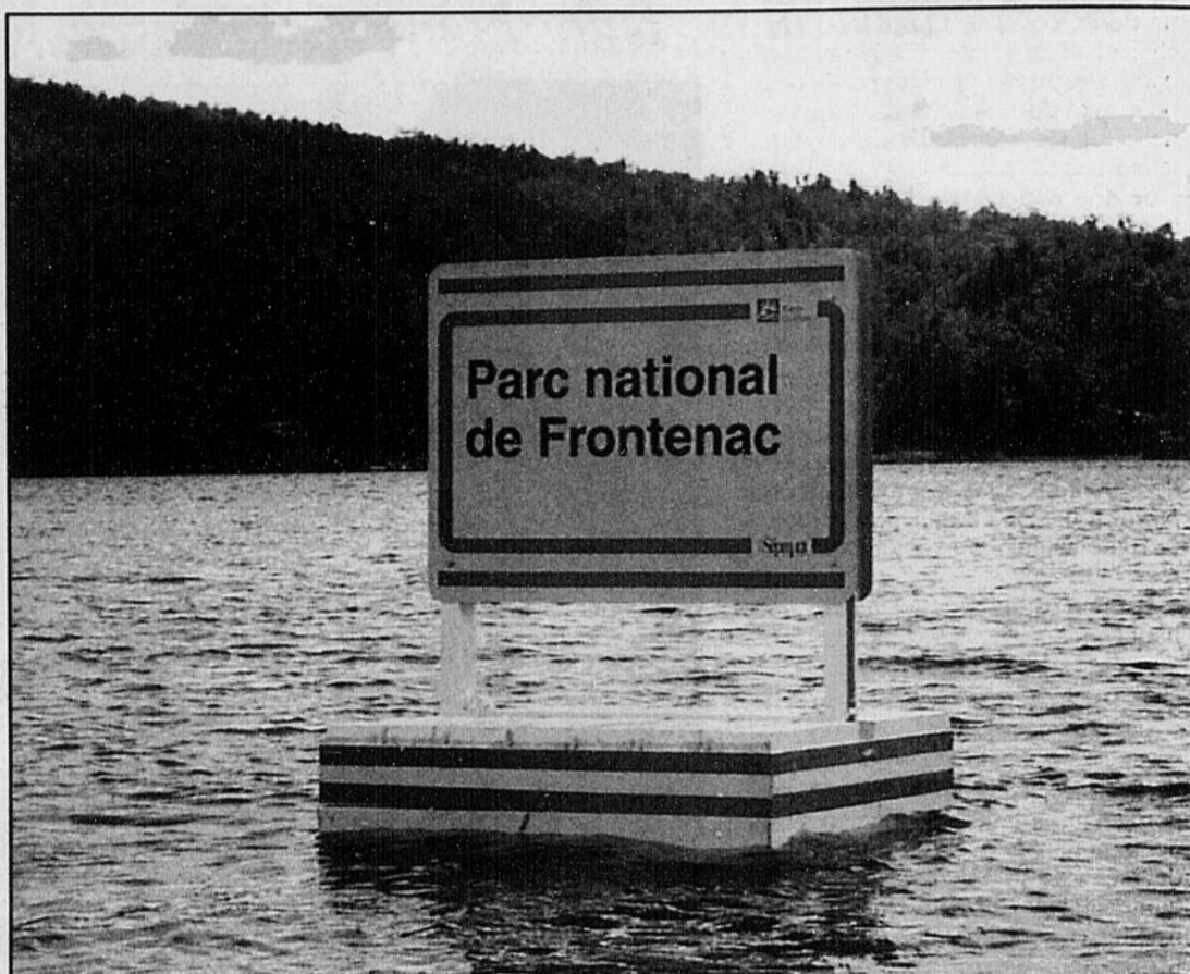
Des bouées installées dans la baie Sauvage du lac Saint-François indiquent clairement aux plaisanciers qu'ils entrent dans le territoire du parc national de Frontenac.

Cette année, la réglementation est appliquée dans la baie Sauvage, mais le parc désire aussi mettre l'impact dans la baie du Rat musqué. Un contrevenant qui sera intercepté une première fois sans avoir son droit d'accès aura un avertissement, et à partir de la seconde fois, des constats d'infractions pourront être émis.